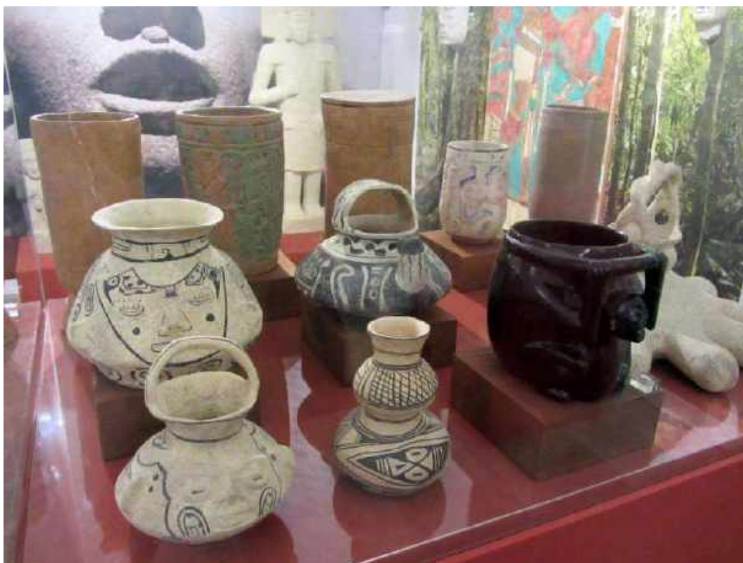
Fig. 4. Réplicas . Vitrina exposición permanente "Altas Culturas Americanas". Instituto de América-Centro Damián Bayón. Santa Fe, Granada.