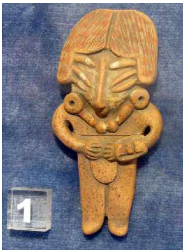
Fig. 5. Réplica , pieza prehistórica del Instituto de América-Centro Damián Bayón.