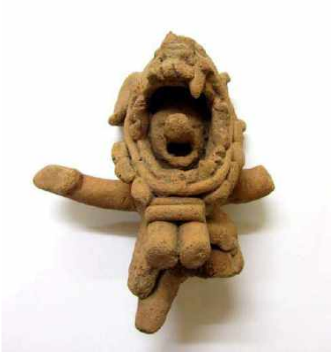
Fig. 1. Ídolo Arcilla , Panamá, Donación del Obispo de Panamá, Museo de Cádiz.