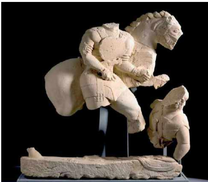
Fig. 1. Representación de escenas heroicas del príncipe de Ipolca. a) Griphomaquia y b) Jinete desmontado alanceando al enemigo caído, anónimo, siglo V a. C. (Foto: Museo de Jaén).