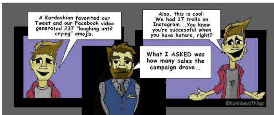
Figura 1. Marketing en medios sociales. @KevinSaysThing ( http://simplymeasured.com/blog/what-if-social-media-isnt-good-enough-and-other-fears-holding-us-back/ )