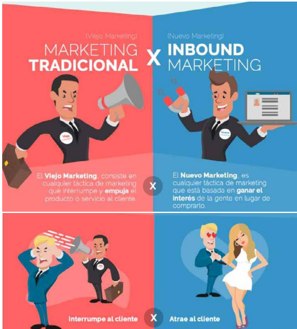
Parte de la Infografía de Alfredo Vela sobre el concepto de Inbound marketing.

Podemos ver que el marketing actual, el marketing de atracción no tiene nada que ver con el marketing tradicional e invasivo, que solo pregonaba las bondades del producto o la marca. Incluso hoy día las marcas han borrado sus nombres de sus logos. Véase el caso de Apple y su manzana y como las marcas están expulsando sus nombres de sus iconos identificativos ( http://www.puomarketing.com/3/27640/marcas-estan-expulsando-nombre-logos.html ).