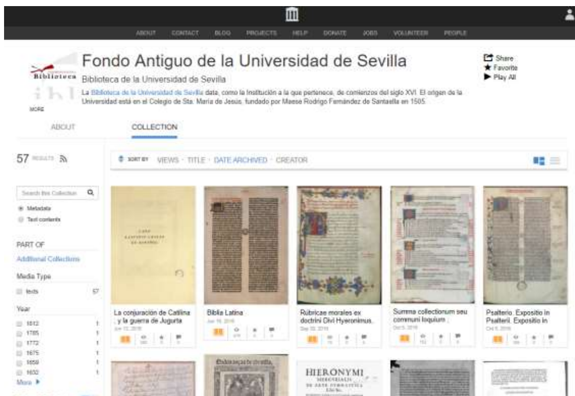
Fig. 5. El Fondo Antiguo de la Biblioteca de la Universidad de Sevilla en la plataforma Internet Archive