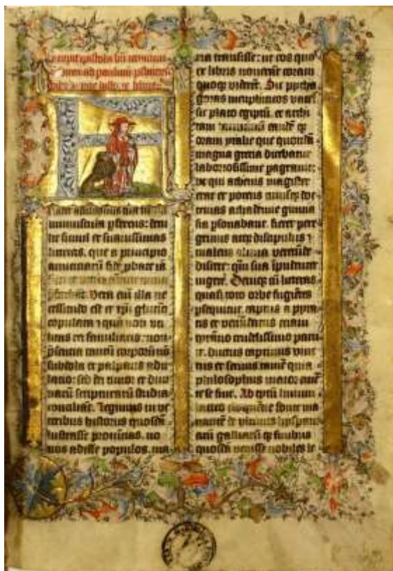
Fig. 1. Biblia Latina. Siglo XV.

El fondo de manuscritos -- 1217 volúmenes procedentes en su mayoría de bibliotecas jesuíticas y conventuales— ocupa los estantes con signatura 330 a 333, independientemente de que haya manuscritos dispersos en la colección general, a veces compartiendo volumen facticio con libros impresos.