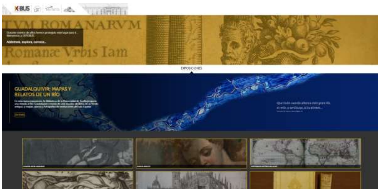
Fig. 6. http://expobus.us.es : ExpoBUS. Espacio Virtual de Exposiciones

La actividad expositiva del Fondo Antigo de la BUS ha llevado a la creación, en 2016, de un Espacio Virtual de Exposiciones , concebido como espacio único donde se puedan alojar todas las exposiciones organizadas en la BUS, y no sólo las de Fondo Antigo. La llamada plataforma ExpoBUS (Fig. 6)