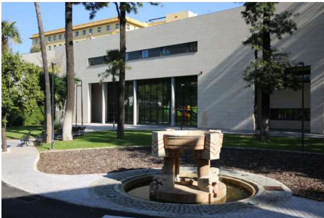
Fig. 4. Actual desde de la Biblioteca General Rector Machado.

Es esta la cuarta sede que ocupa la Biblioteca. La primera fue la del propio Colegio de Santa María de Jesús, intramuros de Sevilla, junto a la Puerta de Jerez, en la que todavía se yergue la Capilla del Colegio, lo único que quedó del edificio tras su demolición a principios del siglo XX. La segunda fue la antigua Casa Profesa de la Compañía de Jesús, hoy Facultad de Bellas Artes, en la Calle Laraña, en la que permaneció la Biblioteca desde 1771 hasta 1954. Ese año se empezó a verificar el traslado a la antigua Fábrica de Tabacos. La Biblioteca se emplazó entonces en dependencias anejas al Rectorado, en la fachada del edificio que da a la calle San Fernando, alojándose las oficinas de la dirección, los servicios centrales y la Sala de Investigación, en la primera planta, mientras que la colección moderna e histórica, y los documentos del Archivo Histórico, ocupaban un depósito de siete plantas y una extensión de mil cuatrocientos metros cuadrados.