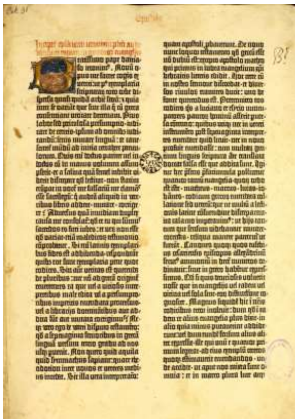
Fig. 2. Biblia Latina. Maguncia, Johannes Gutenberg, 1454.

No se puede describir el fondo incunable de la BUS sin empezar mencionando el ejemplar, con sello de la Casa Profesa, de la Biblia de Gutenberg (Fig. 2). Junto a ella se guardan otras piezas de un valor incalculable, como es el caso del único ejemplar conocido en el mundo de un bellissimo Breviario Carmelitano 7 impreso en Venecia en 1481, y del Repertorium quaestionum super Nicolaum de Tudeschis in libros Decretalium de A. Diaz de Montalvo, que inaugura en 1477 la imprenta sevillana, si bien es muy posible que ya estuviera activo entonces en Sevilla algún impresor.