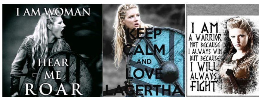
Ilustración 1: Lagertha en redes sociales

Por tanto, se puede ver que las series de televisión pueden servir como vehículos de modelos a seguir por las jóvenes, y, en ocasiones, esos modelos no son tan transgresores como aparentan ser. Con esta base, este artículo tiene como objetivo discutir la representación de la mujer con poder en la serie canadiense Vikings a partir del análisis de su protagonista femenina principal. Un objetivo que se alcanzará por medio de dos vías: en primer lugar, con un análisis del personaje en cuestión. En segundo orden, una comprobación de la percepción de Lagertha en la plataforma Twitter , donde se recopilarán los comentarios que vierten sobre ella los usuarios de esta red social. De este modo, se comprobará si la imagen intencionada de la serie corresponde con el papel representado y con la idea que el público tiene de ella.