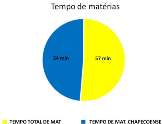
Gráfico 2. Tempo total das reportagens sobre a Chapecoense

Considerando o tempo total de produção, incluindo os intervalos, as entradas ‘ao vivo’ dos repórteres e os textos narrados pelos apresentadores- notas- o noticiário permaneceu 1h25 minutos no ar. O gráfico 2 indica o tempo total dedicado somente às matérias/ reportagens e, àquelas dedicadas ao assunto, dominaram o noticiário.