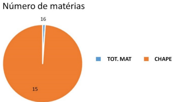
Gráfico 1. Total de reportagens do Jornal Nacional- 29-11-17

Considerando o tempo total de produção, incluindo os intervalos, as entradas ‘ao vivo’ dos repórteres e os textos narrados pelos apresentadores- notas- o noticiário permaneceu 1h25 minutos no ar. O gráfico 2 indica o tempo total dedicado somente às matérias/ reportagens e, àquelas dedicadas ao assunto, dominaram o noticiário.