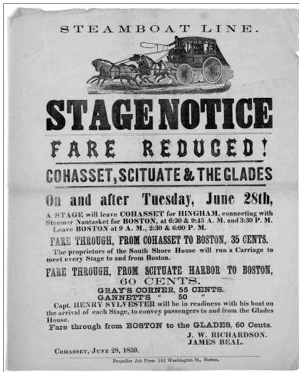
Steamboat line. Stage notice. fare reduced! Cohasset, Scituate & the Glades on and after Tuesday, June 28th ... Cohasset, June 28, 1850. Propeller Job (1859)

En este siglo aparecen en Inglaterra los primeros agentes publicitarios a la sombra de las publicaciones o las imprentas. Se dedican a vender espacios de las publicaciones a negocios locales a cambio de una comisión del medio que ve como aumentan sus ingresos gracias a la publicidad. Comercios, artesanos, medios de transporte... son los anunciantes de la época.