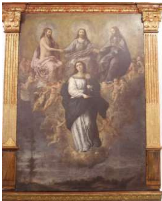
Fig. 4. Inmaculada Eucarística . Museo Fray Pedro Gocial, Convento de San Francisco, Quito. Miguel de Santiago, tercer tercio del S. XVII.

los cabellos esparcidos y los angelitos voltejeando alrededor” apreciables en la imaginería quiteña tendrían resabios pictóricos españoles y, sobre todo, sevillanos.