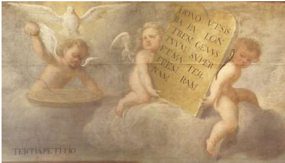
Fig. 6. Detalles de la Doctrina cristiana . Museo Fray Pedro Gocial, Convento de San Francisco. Miguel de Santiago, ca. 1670.