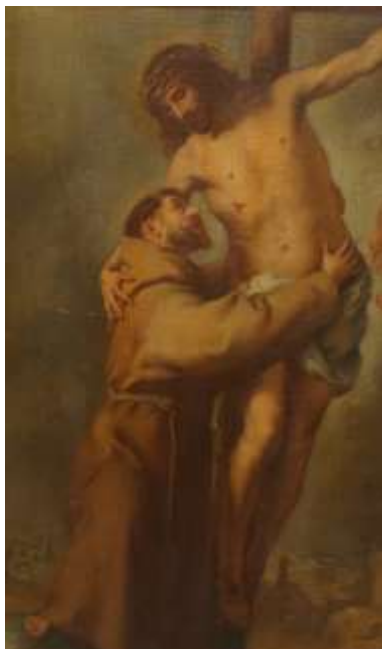
Fig. 2. Detalle de San Francisco abrazando al Crucificado , copia de Bartolomé Esteban Murillo. Museo Alberto Mena Caamaño, Centro Cultural Metropolitano, Quito. Anónimo, S. XIX.

Francisco abrazando al Crucificado (Figura 2), de correcto dibujo y entonación más cercana al original que el resto de obras conservadas en este museo.