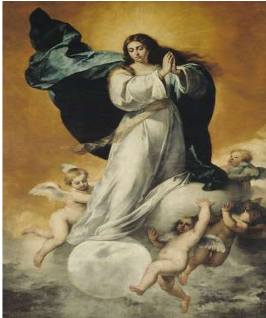
Fig. 5. Inmaculada “la Colosal” . Museo de Bellas Artes, Sevilla. Bartolomé Esteban Murillo, ca. 1650.

Incluso décadas después de González Suárez se cimentaba esta supuesta influencia en el hecho de que a Quito hubiesen llegado obras de la mano del propio Murillo.