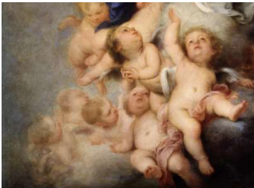
Fig. 7. Inmaculada de Sault . Museo del Prado, Madrid. Bartolomé Esteban Murillo, 1678.