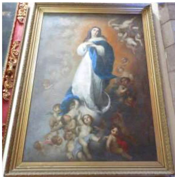
Fig. 3. Inmaculada , copia de Bartolomé Esteban Murillo. Catedral, Quito. Anónimo, S. XIX.

y también el Buen Pastor Niño de colección particular quiteña, de escaso mérito artístico aunque no tan desafortunado como el del Museo Alberto Mena Caamaño, que citamos más arriba.