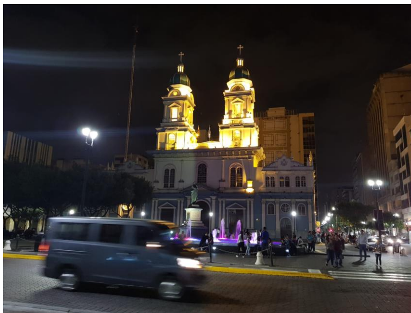
Figura 6.4: Iglesia de San Francisco de Asís de Guayaquil