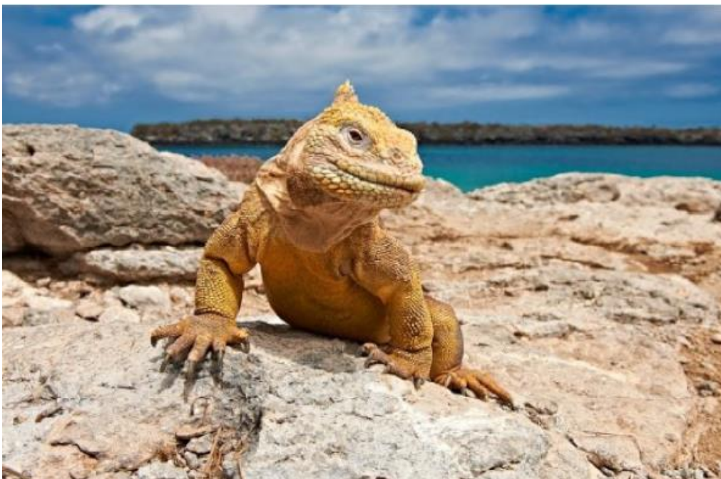
Figura 6.2 Iguana terrestre.