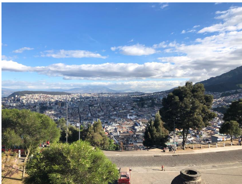
Figura 6.1.1: Panorámica de la ciudad de Quito