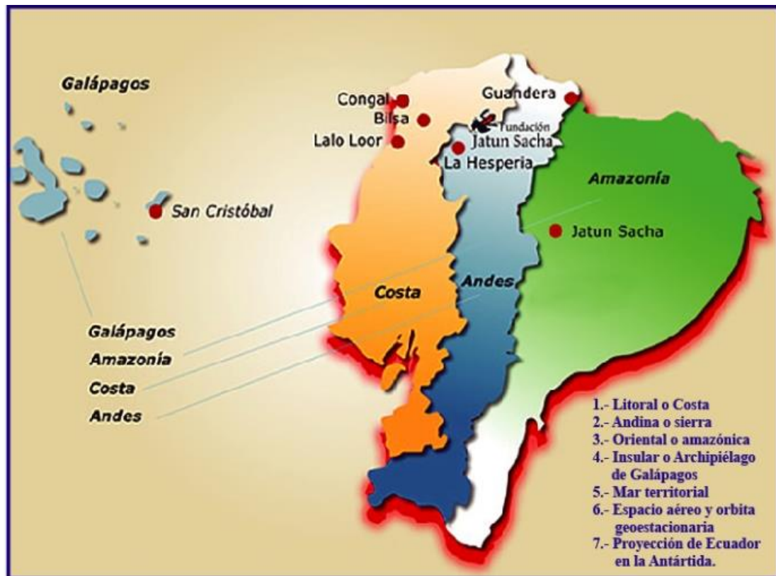
Figura: 2.2 Regiones naturales de Ecuador