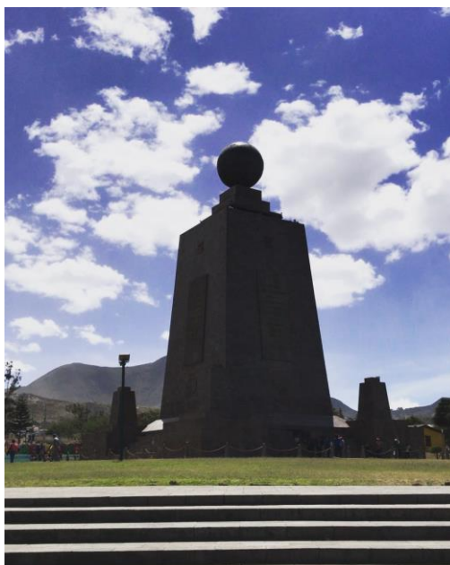
Figura 6.1.2: Monumento de la mitad del mundo