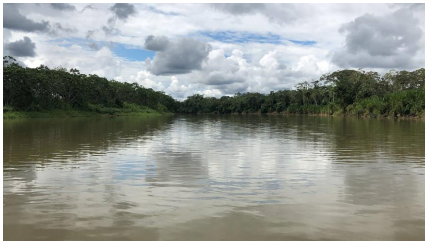
Figura 6.5: Rio Napo