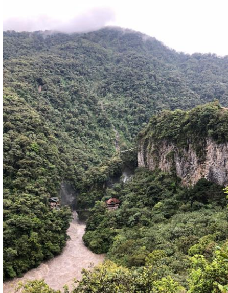
Figura 6.3: El Pailón del diablo