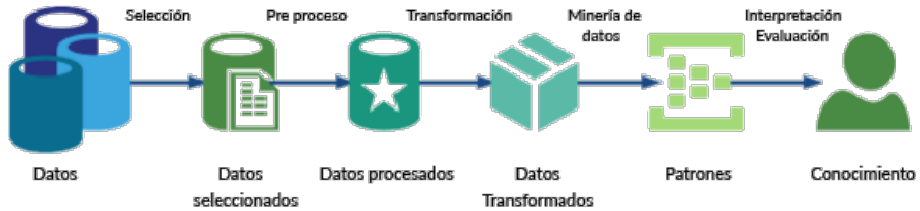
Figura 2. Tratamiento de datos para determinar patrones.

este motivo se ha centrado el caso de estudio en este sector, debido al gran potencial que muestran estas empresas y las posibilidades que facilitan.