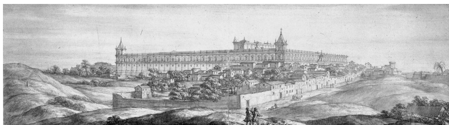
Pier María Baldi (1630 ca.–1686), Vista del hospital desde cima del muladar adyacente a la muralla de la Almenilla , acuarela de principios de enero de 1669; Baldi acompañaba a Cosme III de Médicis (Biblioteca Mediceo-Laurenziana, Florencia)