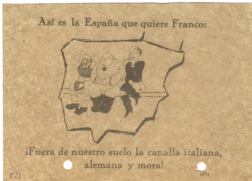
Figura 3: caricatura del apoyo marroquí, alemán e italiano al bando nacional. MCD, CDMH, Panfletos, 821.

del líder ácrata Durruti como héroe de la independencia) y las representaciones militares, que exaltan el valor y la marcialidad. Aparte de estos, también encontramos algunos elementos simbólicos y heráldicos.