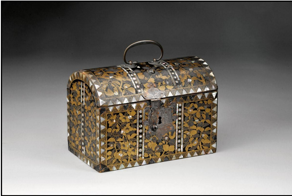
Fig.5. Anónimo japonés, Cofre. Período namban (1543-1639), Colección particular