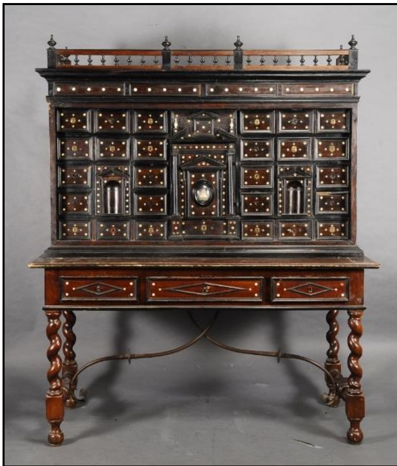
Fig.6. Anónimo novohispano, Terno de escritorio. Fines del siglo XVII, Colección particular