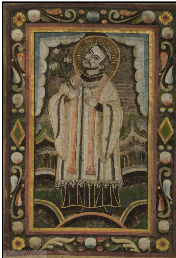
Fig.4. Anónimo novohispano, San Francisco Javier . Siglo XVII, Madrid, Museo de América