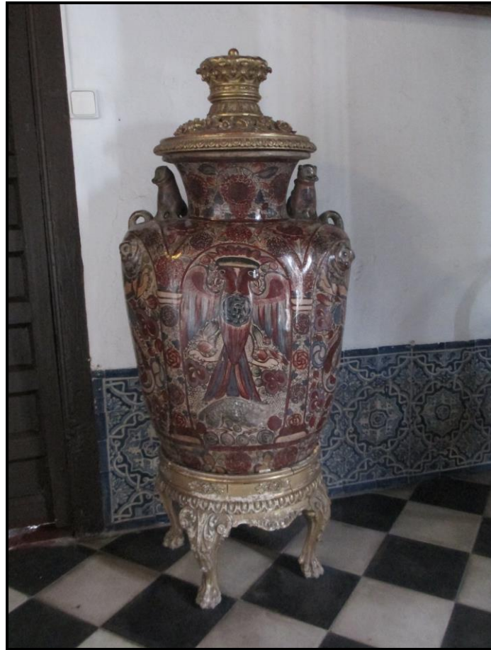
Fig.7. Anónimo novohispano, Tibor. Siglo XVII, Colección particular