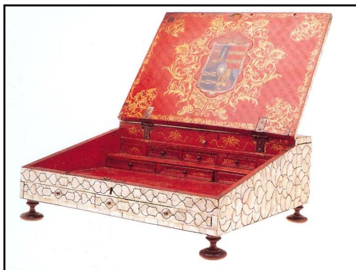
Fig.2. Anónimo novohispano, Escribanía . Hacia 1635-1640, Ciudad de México, Colección Rivero Lake.