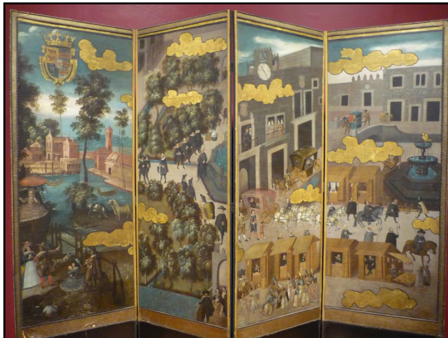
Fig.8. Anónimo novohispano, Biombo con Vista de la plaza Mayor de la ciudad de México y del paseo de Iztacalco . Hacia 1635-1640, Ciudad de México, Colección Rivero Lake