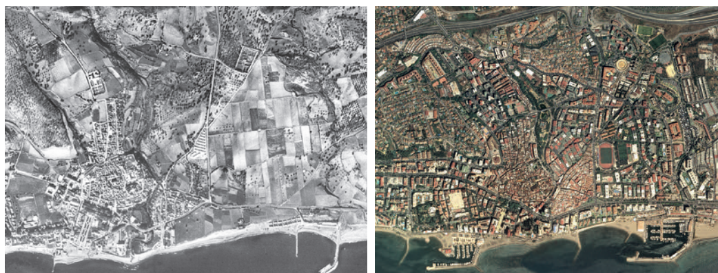
Figura 07-08: Evolución de la ocupación del territorio en Marbella entre 1956 y 2010-2011

Sin embargo, y a pesar de la magnitud de los datos anteriores, también contempla propuestas sustentadas en nuevas ocupaciones de suelo con especial valor estratégico, natural y/o identitario, en las que, junto a instalaciones turísticas especializadas o equipamientos de interés turístico, se abriría la puerta a nuevos usos residenciales o nuevos establecimientos hoteleros. Concretamente, con las Actuaciones Singulares de Excelencia Turística 51 ; o con la previsión de campos de golf 52 en suelo no urbanizable que, tratados como equipamientos de interés turístico y territorial, podrán incluir establecimientos hoteleros, servicio de restauración, etc., complementarias de la actividad.