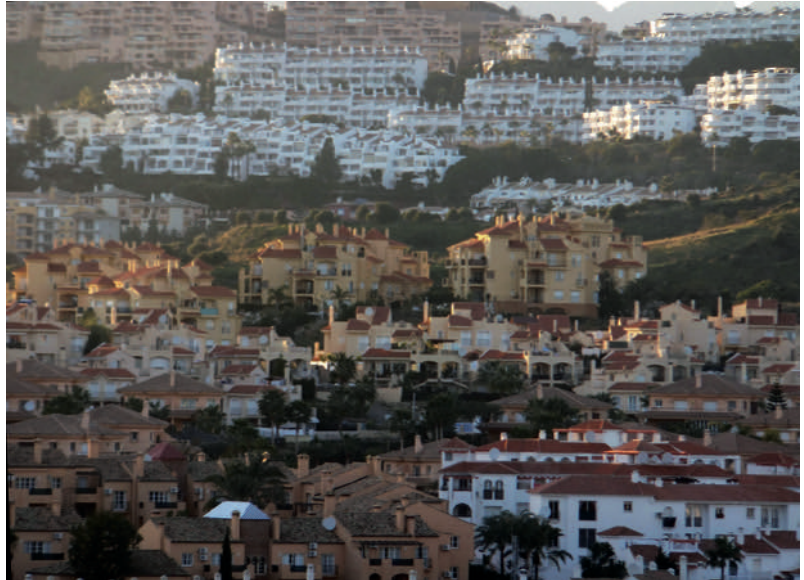
Figura 09: Urbanización Sitio de Calahonda. Mijas-Costa. Málaga

En 1956 la franja urbanizada del litoral de Costa del Sol Occidental 61 alcanzaba 217,8 ha (2,5% del total del litoral andaluz), el 80,7% destinadas a uso residencial. En 2007, preludio del estallido de la burbuja inmobiliaria, la superficie artificial ascendía a 14.936,8 ha (19,9 % del total del litoral andaluz), el 55% destinadas a uso residencial (Figuras 05-09).