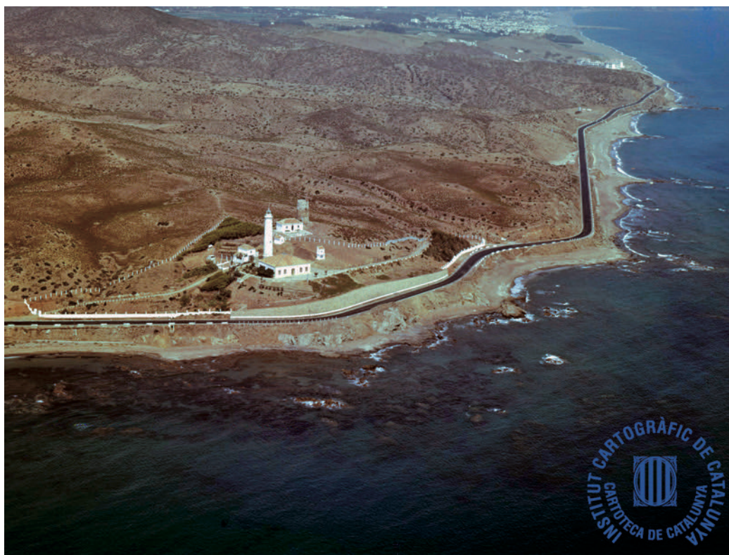
Figura 04: Años 50-60, panorámica N-340 a su paso por Mijas Costa, con el Faro de Calaburra en primer plano

de forma sustancial la participación de las administraciones autonómica y local en las propuestas de ordenación, distribución de usos y organización del territorio del espacio turístico, en base a los principios emanados de la Constitución Española de 1978 que estableció el nuevo reparto de competencias que debería asumir el Estado y las Comunidades Autónomas. Desde ese momento las relacionadas con la política territorial, la ordenación del territorio, el litoral, el urbanismo, la vivienda y el turismo, fueron asumidas en exclusividad por la Comunidad Autónoma de Andalucía 37 (Figura 04).