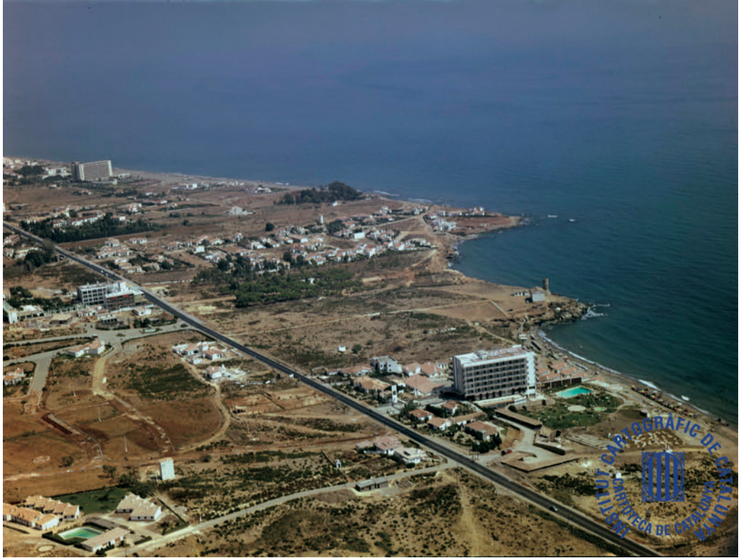
Figura 03: Años 60, panorámica N-340 a su paso por Benalmádena, con el hotel Tritón, inaugurado en 1961, en primer plano a la derecha