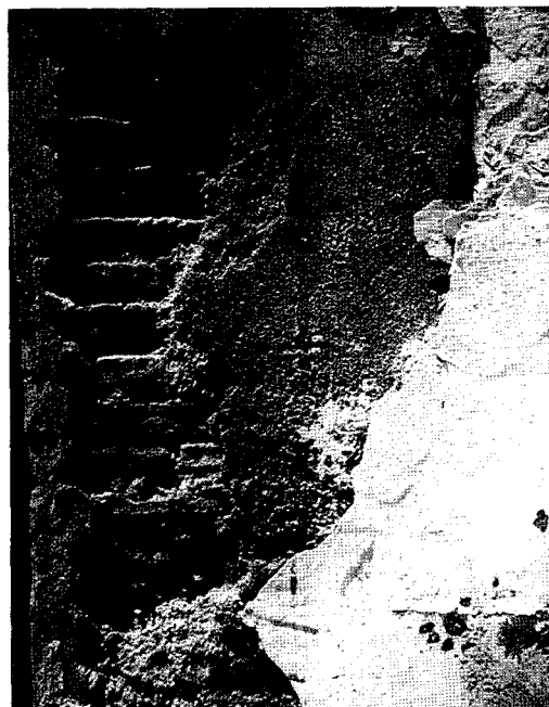
figura 4. Morteros de albero en muros y en revestimientos