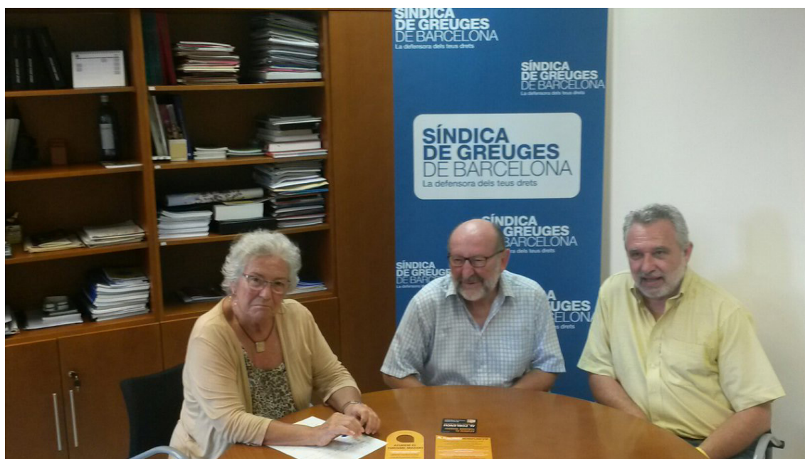
Figura 5.- Reunió de representants d' #EnsPlantem amb la Síndica de Greuges (05-08-2016).

A més d'aquestes accions, la plataforma va mantenir una línia d'acostament amb diferents grups polítics i institucions municipals amb l'objectiu de, per una banda, donar a conèixer la situació que estava vivint el barri i, de l'altra, tractar d'influir en la regulació municipal vinculada al control i planejament de les instal·lacions i equipaments turístics que, al llarg de 2016 i 2017, es va estar discutint a l'Ajuntament.