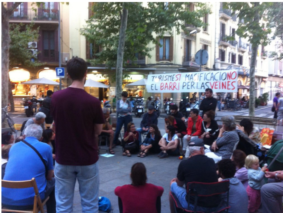
Figura 7.- Assemblea-sopar d'#EnsPlantem a la Rambla (14-06-2016).

Tal com es pot veure a la Figura 6.- entre els anys 2010 i 2018, l'espai ocupat per les terrasses es va veure multiplicat per deu, arribant als 852 m 2 , tot i que amb un pic de 947 m 2 a 2016, mentre que les llicències van passar de 12 a 56 per al mateix període 30 .