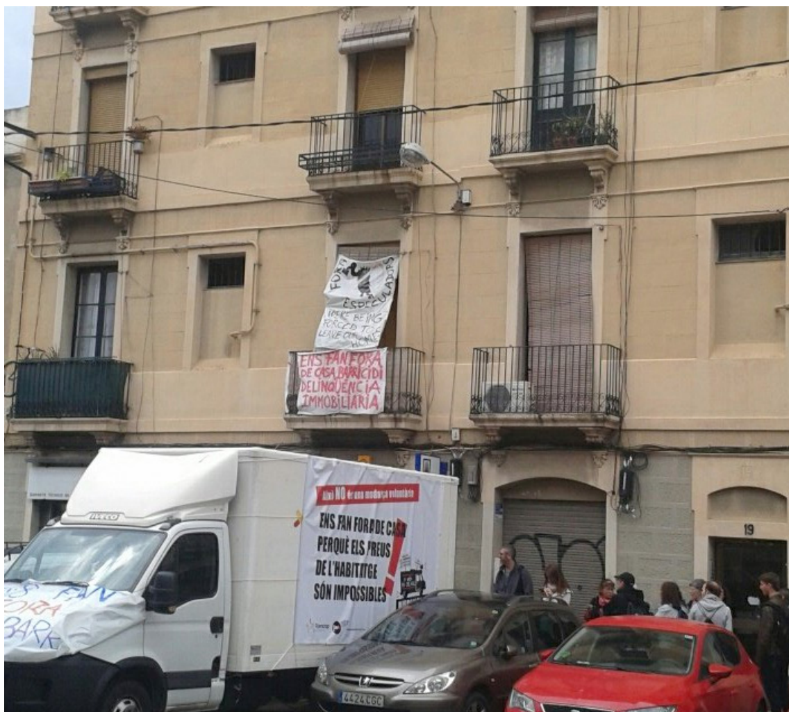
Figura 4.- La mudança de protesta al Poblenou (10-05-2018).