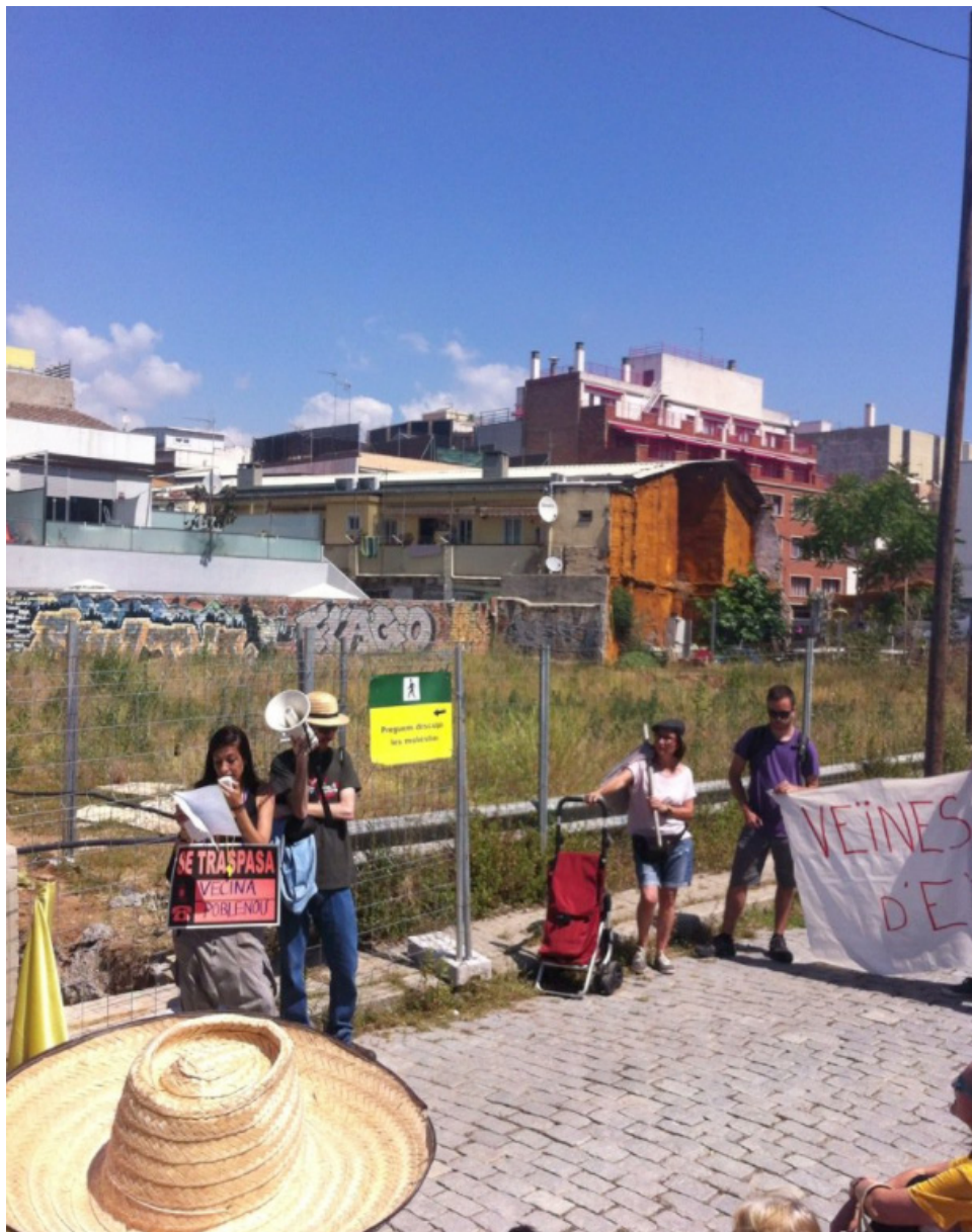
Figura 2.- La Ruta de l'Especulació al seu pas per un dels antics horts (05-06-2016).

d'acollir establiments hotelers, així com antics solars convertits en horts urbans, com el denominat Hort Indignat 1 15 , espai ocupat per l'extinta Assemblea Social del Poblenou (ASP9), hereva del moviment 15M al barri, i que pertanyia a l'anomenat SAREB (Societat de Gestió d'actius procedents de la Reestructuració Bancària) o Banc Dolent , és a dir, l'organisme constituït pel Govern de l'Estat per adquirir actius immobiliaris pertanyents a entitats financeres en procés de sanejament.