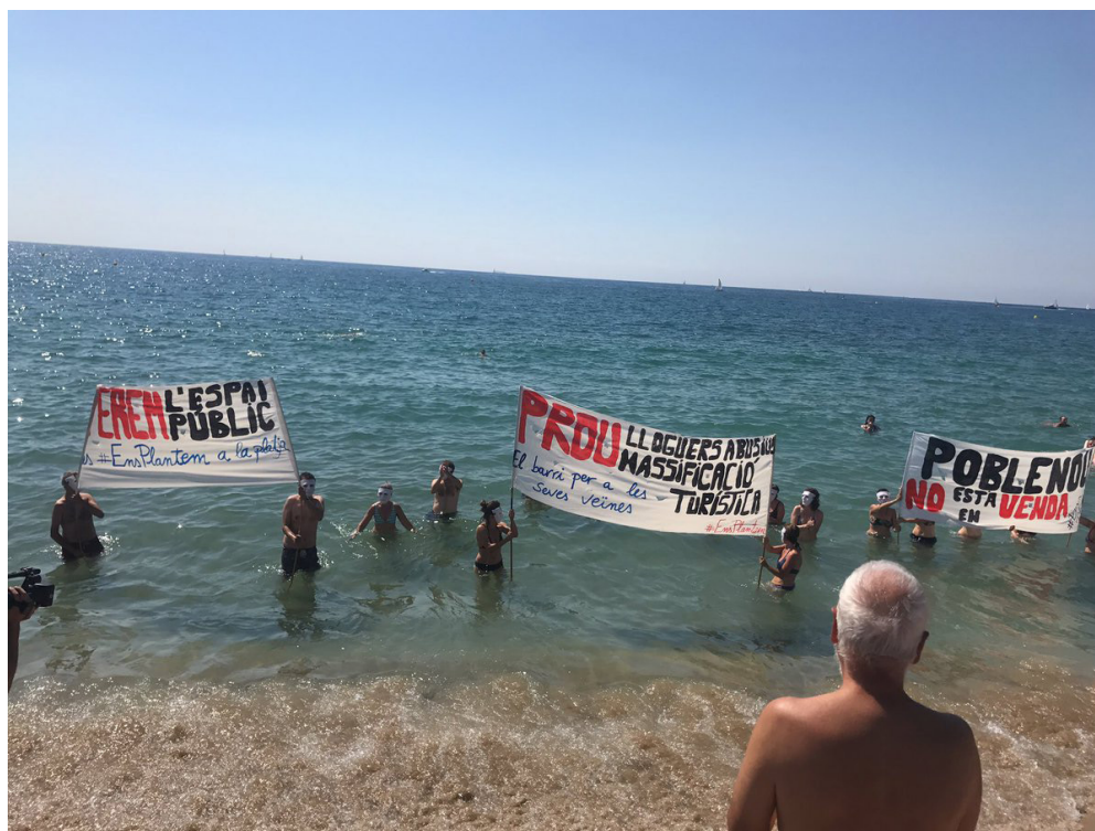
Figura 8.- Acte de protesta a la platja de la Marbella (09-07-2017).

Finalment, la denúncia que #EnsPlantem porta a terme sobre la privatització de l’espai urbà del barri s’amplia, també, a les platges properes. Un petit grup d’activistes va recórrer la Rambla del Poblenou el juliol de 2017 exigint recuperar l’espai públic de les platges, copat per “les hamaques de pagament que ocupen l’espai de la sorra” (Beteve, 2017) 33 .