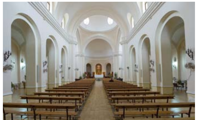
Arcos de la nave principal de la Iglesia de San Antonio de Padua.