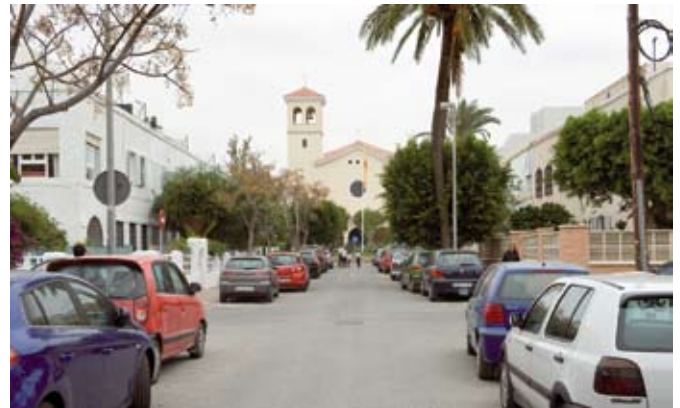
Vista de la Iglesia San Antonio de Padua desde la calle Castilla.

Esto se hace extensivo a la cuidada volumetría de los distintos tipos de viviendas desde el proyecto, que procuraban la ruptura de la calle corredor, la reducción de altura en las esquinas merced a la creación de porches abiertos a los jardines, así como terrazas