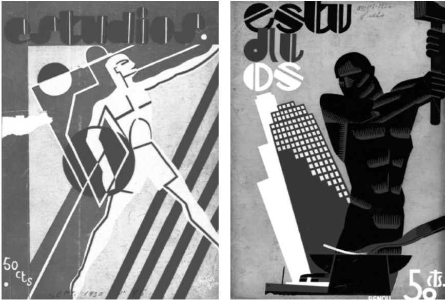
FIGURA I. Desnudos de hombres y mujeres en Estudios entre 1930 y 1937

Arriba, de izquierda a derecha, imágenes 1 y 2 representando desnudos masculinos: Estudios , 85, septiembre de 1930; 107, julio de 1932. Abajo, de izquierda a derecha, imágenes 3 y 4 mostrando los desnudos femeninos: Estudios , 137, enero de 1935; 157, octubre de 1936.