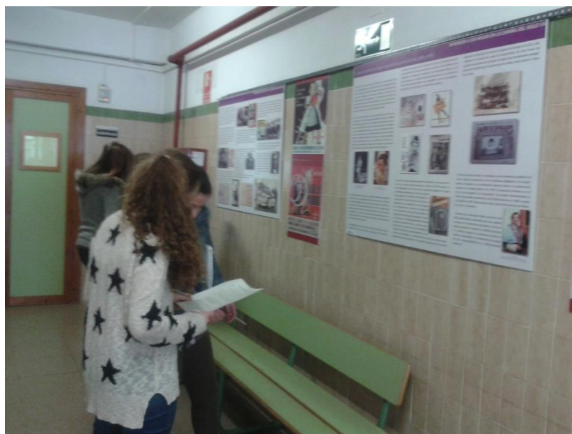
La Exposición en el IES Nervión (Sevilla)

Por otra parte, la actividad no ha terminado, sino que su difusión continúa. Por ejemplo, el IES Nervión la ha albergado con motivo del día 8 de marzo, y hemos comprobado que, con objetivos y desarrollo adaptados, la experiencia también funciona en la enseñanza media.