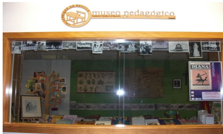
Ventana panorámica a la exposición permanente y logo del Museo