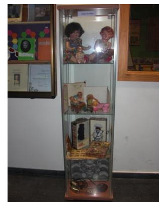
Vitrina con juguetes