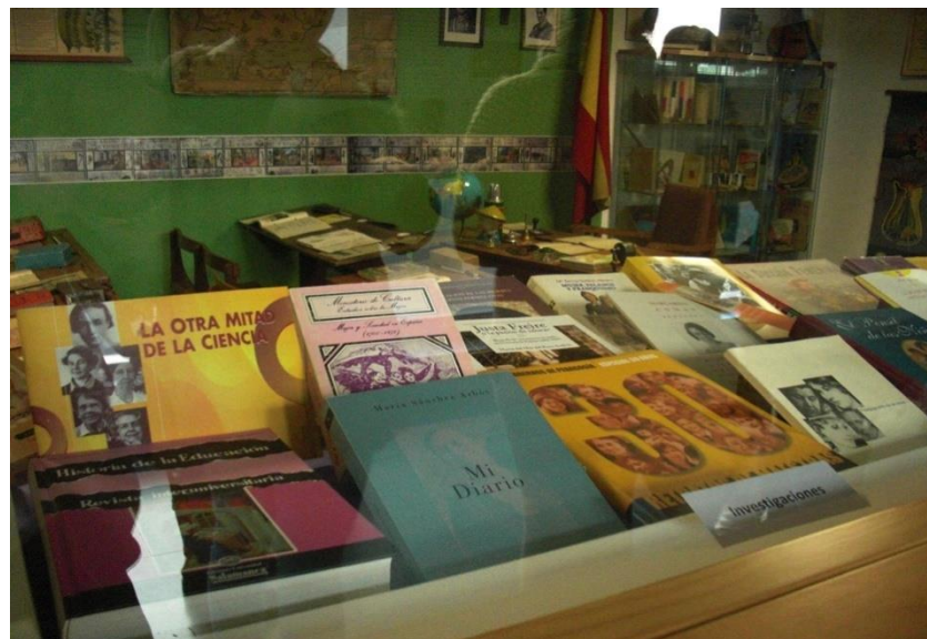
Muestra de publicaciones y materiales didácticos

El procedimiento utilizado para la evaluación y recopilación de datos sobre la satisfacción de las personas beneficiarias fue el siguiente. Dada la idiosincrasia de la actividad, se ha preferido no utilizar el cuestionario en principio pensado como mecanismo de evaluación. En su lugar, se ha optado por una medición más cualitativa de los resultados.