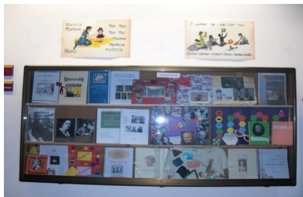
Tablón con trabajos del alumnado