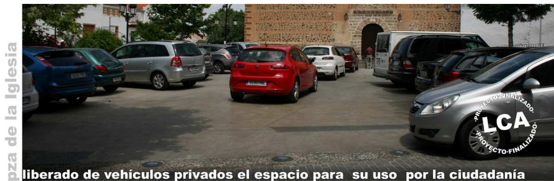
Imagen.2. Espacio resultante de la intervención dentro del Programa LCA: Plaza de la Iglesia “liberada” de vehículos privados

Tras someter a los 21 proyectos licitados a este análisis, los resultados son contundentes, tan sólo 3 de las propuestas son Aptas, es decir, responden adecuadamente a los criterios evaluados en las Áreas Descriptiva, Inclusión y Medio Ambiente Urbano Sostenible.