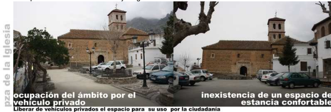
Imagen.1. Espacio previo a la intervención dentro del Programa LCA: Plaza de la Iglesia ocupada por los vehículos privados

A la vista de los resultados –la plaza sigue ocupada como lugar de aparcamiento para el vehículo privado-, se duda de que la inversión realizada haya logrado una transformación sustancial de la realidad urbana.