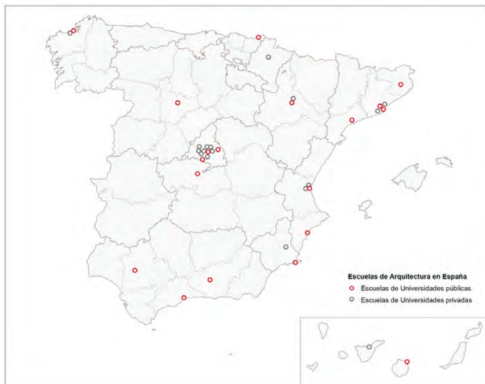
Figura 1. Distribución de la enseñanza de la Arquitectura en España

Fuente: Elaboración propia (Dibujado por Javier Ostos Prieto y Juan Andrés Rodríguez Lora).