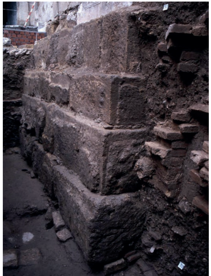
Figura 1. Fotografía del basamento enterrado de la Giralda (Catedral de Sevilla; España), excavado en 1998; las cuatro hiladas de sillares almohadillados descansan sobre la argamasa de reparto. Sobre los sillares vemos un ara romana tumbada. En el sillar inferior de la esquina se percibe la marca en forma de "V" con trazo horizontal (foto del autor).

formada por cuatro sillares en las esquinas; en la hilada inferior de las visibles hay seis aras romanas tumbadas, algunas con epigrafía latina; en total la altura de las diez hiladas pétreas (cuatro almohadilladas, cinco lisas, incluidas las aras, y la incompleta), suman 5,10 m de altura; desde ahí hasta el ápice de la torre, todo era hasta el siglo XVI de ladrillo, salvo las más de cien columnas que la decoraban, formadas por piezas de acarreo muy variadas, (romanas, tardoantiguas, emirales, califales, almorávides y almohades), la mayoría colocadas en época andalusí, pero también alguna se insertó en el siglo XVI y sobre todo en el XIX, cuando sustituyeron 17 basas, 42 fustes y 13 capiteles.