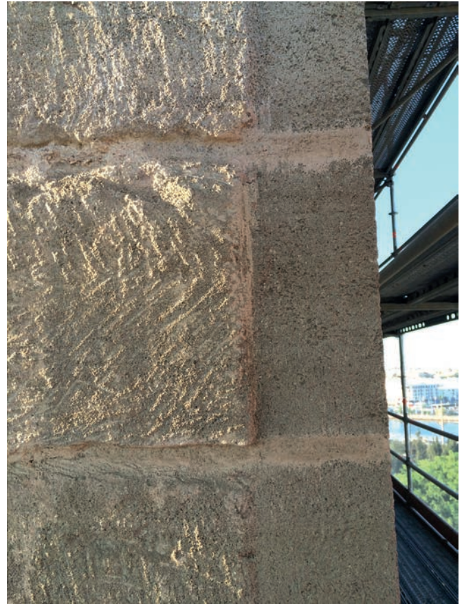
Figura 5. Fotografía de un tramo de la esquina noroeste de la "Tour Hassan" (Rabat, Marruecos), realizadas en 2015; se aprecian los rastros del instrumento destinado a eliminar el almohadillado de los sillares una vez completada la labra definitiva de la banda lisa para aplomar la esquina.

En la cara lateral de levante, junto a la esquina noroeste, a la altura del comienzo del paño de katf wa-dārġ, fotografíe tres marcas en el almohadillado, torcidas respecto a las juntas, tan grandes y poco cuidadosas como las de los cimientos almohades sevillanos; una de ellas figura un triángulo rectángulo, otra es como uno isósceles y la tercera son dos "V" con un trazo común, bocabajo; en otras piezas se atisban triángulos de uno u otro tipo y trazos inconexos, que, habida cuenta de las "dificultades gráficas" del soporte, pudieran ser elementos del alifato. No conozco publicaciones sobre estos signos del alminar rabatí, aunque se han mencionado los del interior sin más datos que estos "D'autres inscriptions analogues [a las 18 que veremos más adelante] figurent également sur les murs intérieurs du minaret [...]" (Caillé 1954: 14).