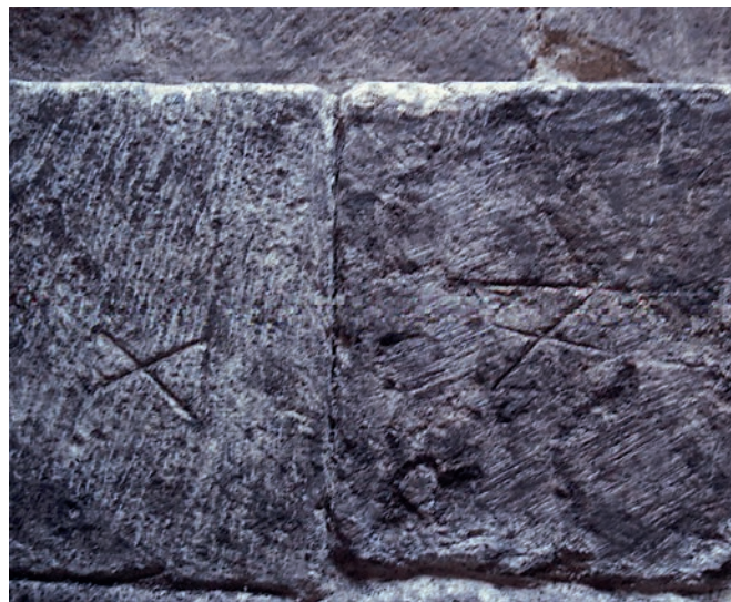
Figura 2. Fotografía de los sillares del basamento aparecidos ante la Puerta del Perdón (Catedral de Sevilla; España), excavados en el año 2000; la imagen muestra dos de los sillares que aparecen signados con marcas de canteros almohades, coetáneos o levemente posteriores a las obras de la Giralda.

Aquí pretendemos mostrar cómo el examen directo de otra torre almohade, la llamada “Tour al-Ḥassān” de Rabat, cuya fecha es bien conocida, lleva directamente a la conclusión de que los sillares almohadillados también son almohades y que las marcas son signos personales de canteros que trabajaban para el todopoderoso califa de los Unitarios en el culmen de su gloria. Es cosa sabida que los sillares almohadillados suponen un importante ahorro de mano de obra, la necesaria para que queden planas y aplomadas las caras de los sillares paralelepípedicos; ello les permite soportar un transporte poco cuidadoso y, en caso de fortificaciones, facilita una mayor resistencia a los impactos; pero la necesidad de aplomar rigurosamente las hiladas almohadilladas y dar continuidad a sus paramentos obligó a labrarles a todos un marco liso, bien escuadrado, que permitiera advertir los errores durante la colocación; se trata de la disposición llamada, en el mundo clásico, anathyrosis . El resultado fue muy apreciado, además, por su expresividad (Jiménez Martín 1989: 113, 185 y 192) y por eso estuvo presente en fortificaciones helenísticas, edificios de época del emperador Claudio, en el zócalo del palacio de Carlos V en la Alhambra o las obras parisinas de Ledoux, ejemplos preclaros de exhibiciones arquitectónicas relacionadas directamente