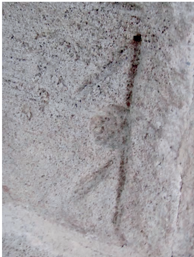
Figura 6. Fotografía de un sillar próximo al comienzo de la decoración de la cara este de la "Tour Hassan" (Rabat, Marruecos), realizadas en 2015; la imagen presenta una de las marcas reseñadas en el texto, que probablemente sea lo que resta de un breve y esquemático texto, una vez eliminado el almohadillado de manera parcial.

no lo conservan, es decir, sólo en casos excepcionales basados en el número de hiladas, es fácil advertir el cuidado de las esquinas y de las juntas en general. La cronología es amplia, ya que el procedimiento está atestiguado desde los últimos tiempos de la Córdoba califal (Torres Balbás 1941: 31), aunque uno de los ejemplos más citados, como es la albarrana de la Puerta de Sevilla, en Córdoba, debe retrasarse al siglo XIV (Escobar Camacho 1987: 134), concretamente a partir del año 1369; este ejemplo de almohadillado mudéjar es, en realidad, el último caso que conocemos de los cuidados aparejos que caracterizan los zócalos de las portadas de los palacios del rey don Pedro (1350-1366), pues eso es lo que vemos en Astudillo (Palencia), Tordesillas (Valladolid) y Sevilla (Almagro Gorbea 2013: 29, 31 y 43). En la misma Córdoba se ha documentado un paramento almohadillado de época almohade que, al margen de los que aportan las presentes páginas, conecta las obras califales con las postalmohades (León Muñoz 2013: