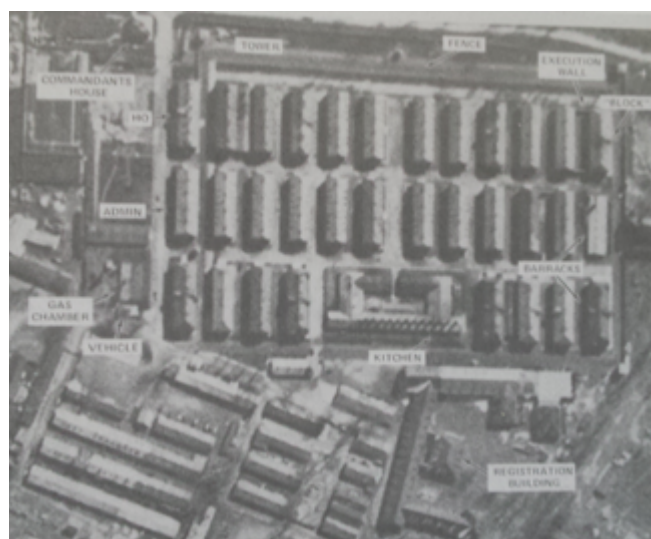
Figura 1. Primeras imágenes aéreas del campo de concentración de Auschwitz

Este tipo de crítica dialógico-visual tiene, en el caso de Farocki, un origen bastante preciso en el contexto de la Alemania Occidental durante la guerra de Vietnam y los años siguientes, en los que se generalizó el uso político de imágenes tanto por parte de los medios conservadores como entre