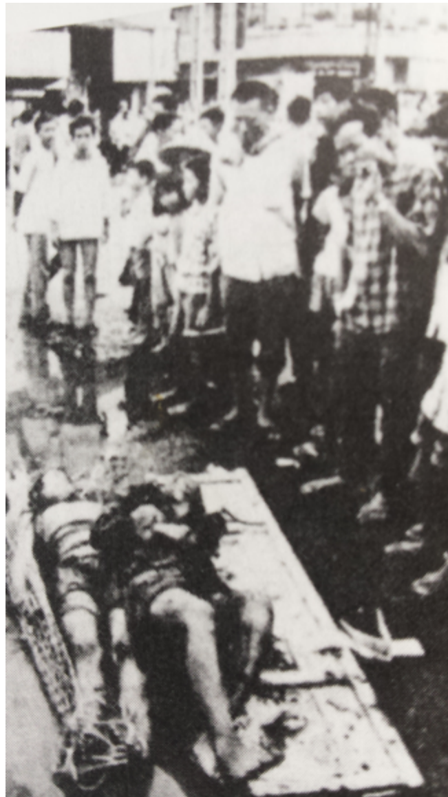
Figura 3. Víctimas de un atentado comunista en Saigón.

los manifestantes pacifistas. Se trataba de una utilización agresiva de imágenes crudas, violentas, que funcionaban como armas arrojadas con las que defender las propias convicciones. Son precisamente estas imágenes las que Farocki convoca en sus primeros trabajos audiovisuales y escritos, con la intención de entender los contextos socio-culturales diversos sobre los que impactan, así como las intenciones que las generan. En un ensayo titulado Dog from the freeway [Un perro de la autopista], Farocki da cuenta de un episodio de