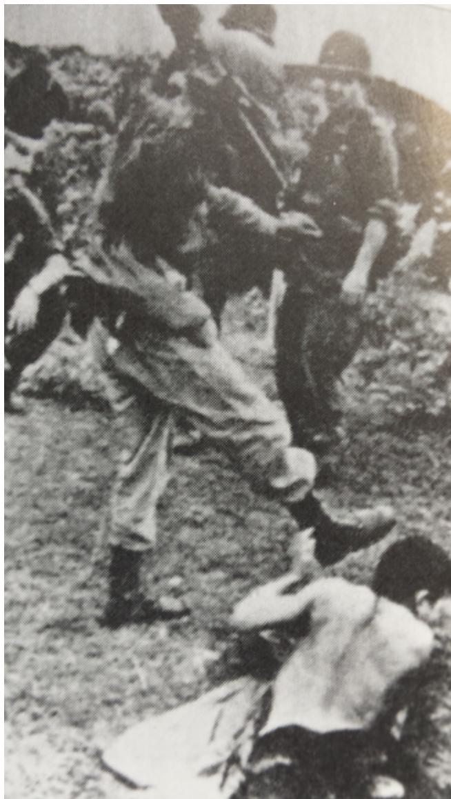
Figura 2. En la imagen, un soldado norteamericano golpea a un prisionero vietnamita.

los manifestantes pacifistas. Se trataba de una utilización agresiva de imágenes crudas, violentas, que funcionaban como armas arrojadas con las que defender las propias convicciones. Son precisamente estas imágenes las que Farocki convoca en sus primeros trabajos audiovisuales y escritos, con la intención de entender los contextos socio-culturales diversos sobre los que impactan, así como las intenciones que las generan. En un ensayo titulado Dog from the freeway [Un perro de la autopista], Farocki da cuenta de un episodio de