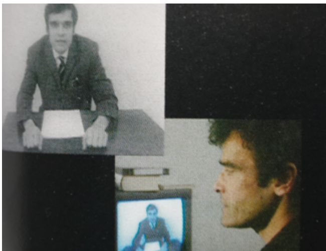
Figura 5. Farocki frente a su propia imagen en Schnittstelle .

Farocki denomina este tipo de trabajo con las imágenes como «influencia cruzada» o «montaje blando» asegurando que promueven un esquema interpretativo que estimula aún más ensayo y menos afirmación, al tiempo que explicita aún más la relación dialógica desde la que se pretende indagar el significado de cada imagen: el espectador tiene la opción ahora de observar en la materialidad del dispositivo la forma en la que las imágenes adquieren diferentes tonalidades dialógicas dependiendo de los elementos audiovisuales que este pone en relación. «Podía introducir un título en uno de los canales mientras que en el otro seguía transcurriendo la imagen, de modo que el espectador tuviera la opción de elegir con qué canal relacionaba el título o si lo relacionaba con los dos. También podíamos interrumpir con un título el flujo de imágenes en los dos canales o mostrar en ambos la misma imagen». Es también la apuesta por disgregar los elementos que componen el film y acercar al espectador a las dinámicas productivas la que va a marcar el paso de las imágenes de Farocki al espacio del museo en busca de una audiencia «con una idea un poco menos limitada de cómo deben ensamblarse las imágenes con los sonidos» (FAROCKI, 2014: 118)