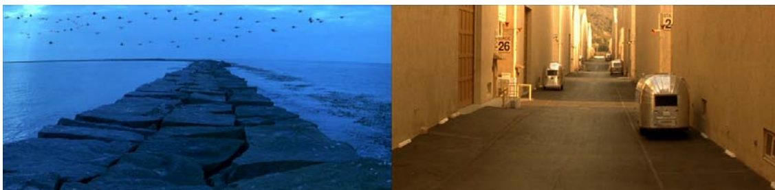
Ilustración III. Mundo ficcional vs. mundo factual: idénticas estructuras visuales.

Comienza Simone con la asociación de dos universos diferentes pero intersecados: la ficción del relato Amanecer atardecer y una calle de los estudios hollywoodienses donde se rodó, lo cual viene a resumir la esencia temática de la película: los universos ficcionales y el empírico son indisolubles porque se nutren entre sí, aunque dissociables porque operan de maneras bien distintas.