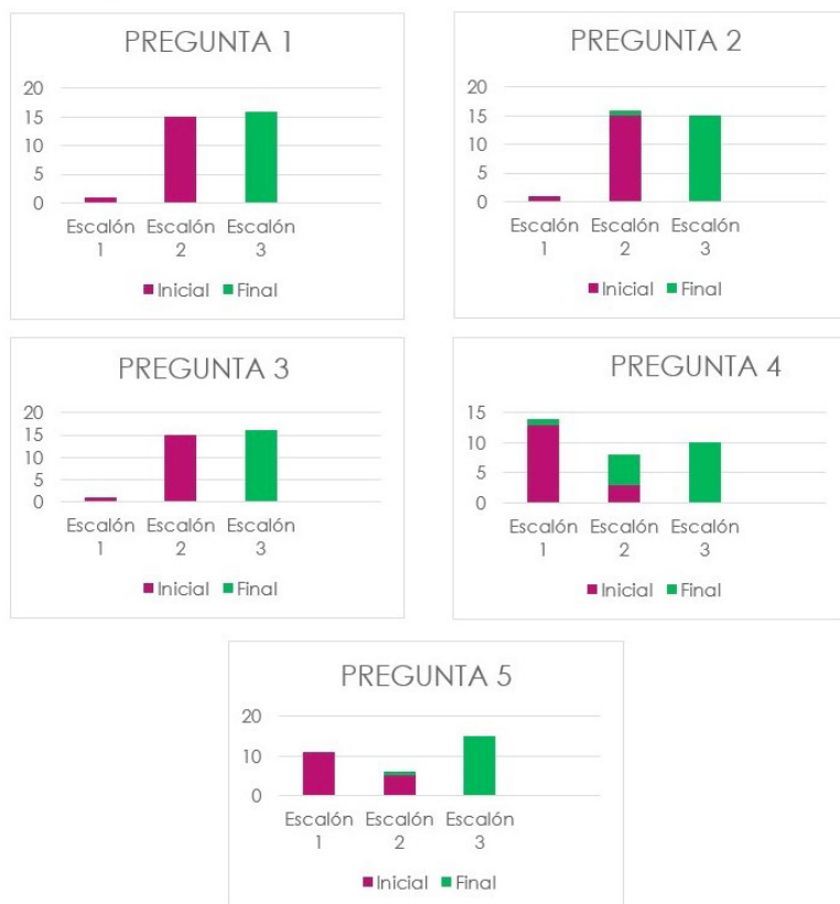
Figura 3. Resultados de la evaluación de los aprendizajes de los estudiantes en las 5 preguntas de los cuestionarios inicial y final.

Estos criterios se han mantenidos en todos los instrumentos de evaluación. A continuación, desarrollamos los resultados obtenidos, más concretamente, a partir del análisis de los cuestionarios iniciales y finales de los alumnos, según la escalera de progresión que hemos establecido para el análisis e interpretación de dichos resultados.