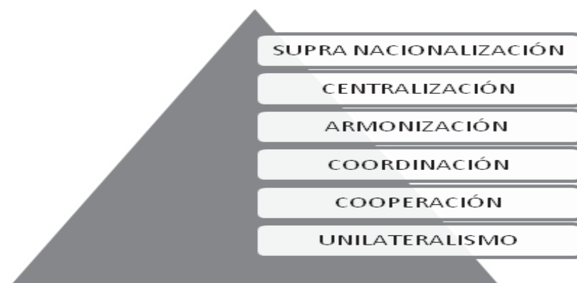
FIGURA 1. NIVELES DE COOPERACIÓN INTERNACIONAL EN MATERIA DE COMPETENCIA

Partiendo del esquema de Mitschke (2008: 11), y una vez completadas las etapas de unilateralismo, cooperación, coordinación y armonización respecto a los hard core cartels , creemos posible y deseable explorar el siguiente paso: la centralización.