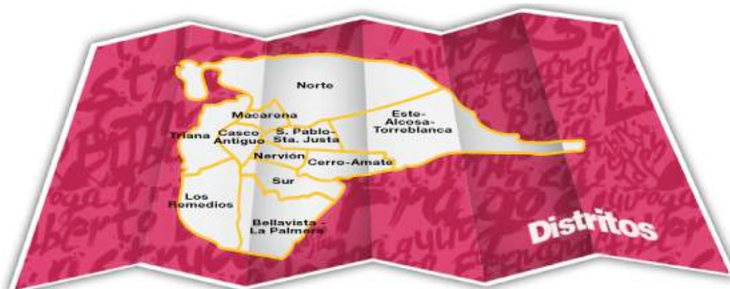
Figura 1. El distrito de Nervión en el municipio de Sevilla