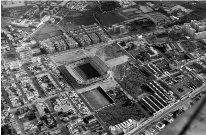
Figura 7. Vista del centro neurálgico del barrio de Nervión anterior a la apertura de la avenida de San Francisco Javier y la calle Luis de Morales