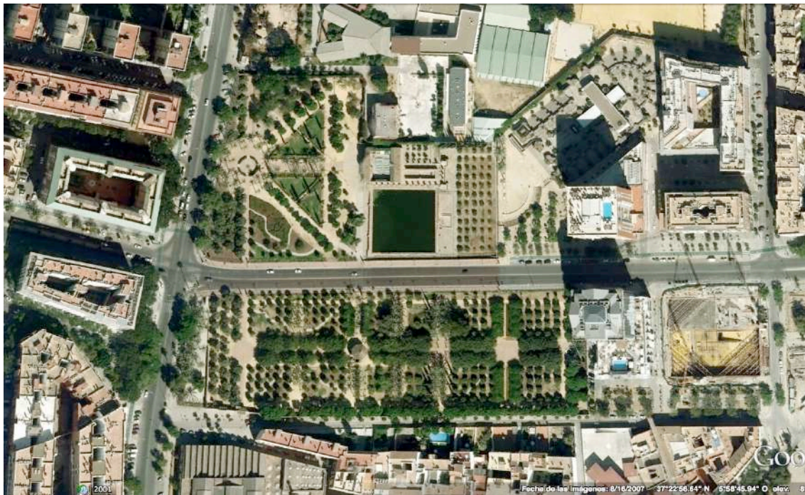
Figura 8. Entorno de los jardines de la Buhaira