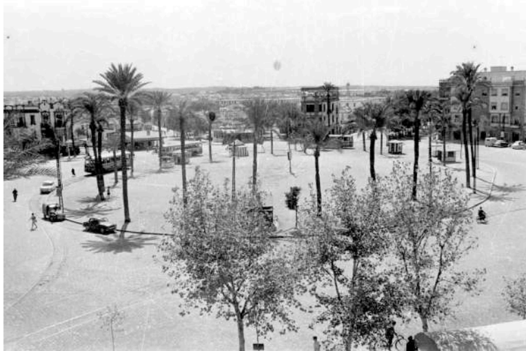
Figura 5. Vista de la Gran Plaza del Capitán Cortés