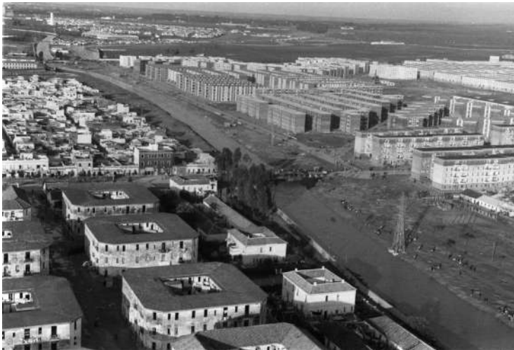
Figura 6. Vista aérea del sector que comprende la calle Marqués de Pickman y las viviendas colectivas de Ciudad Jardín durante una crecida del arroyo Tamarguillo, 1962