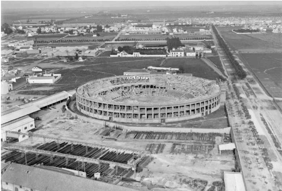
Figura 3. Bulevar de la calle Eduardo Dato y plaza de toros Monumental (años 20)