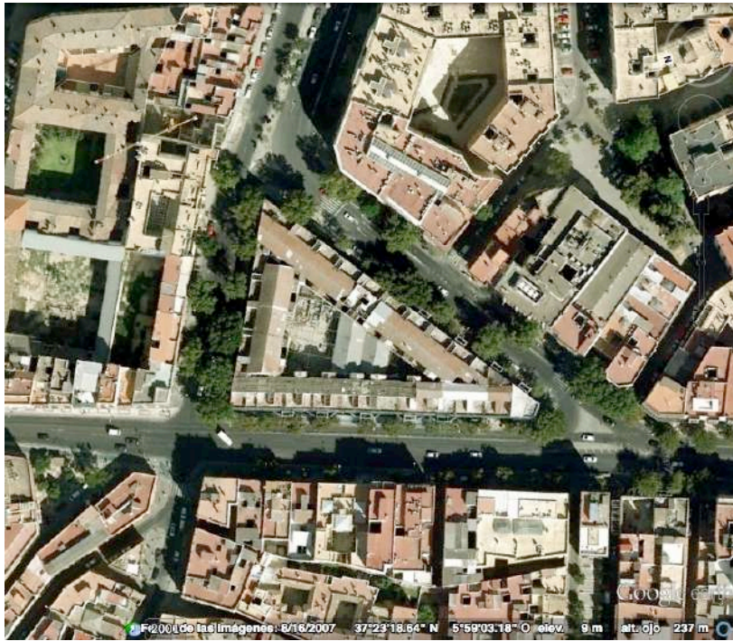
Figura 4. Imagen antes de la demolición de la manzana de La Florida