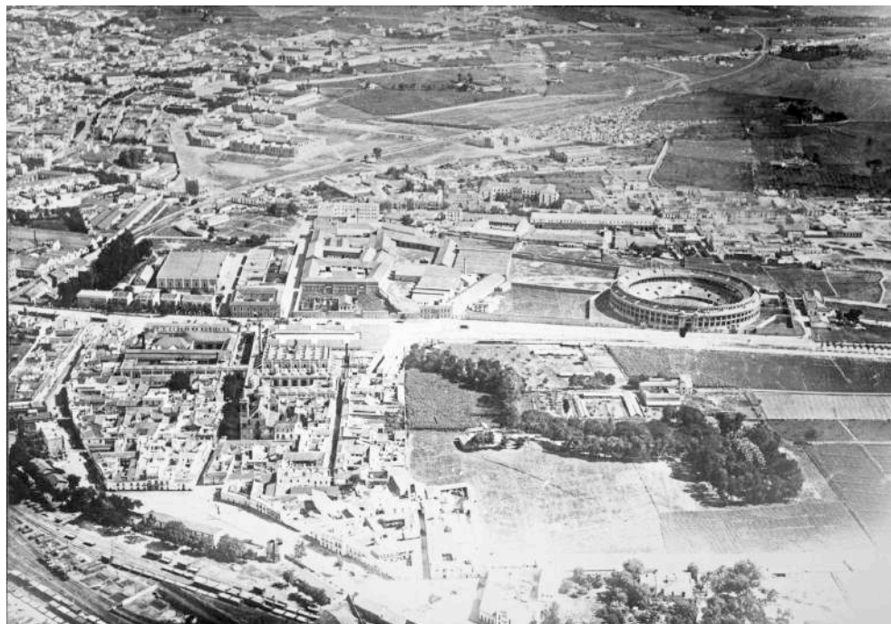
Figura 3 Vista aérea del sector occidental del actual distrito de Nervión (ca. 1925)