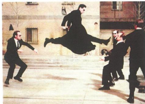
Fig. 6. Fotograma de la película Matrix (Andy y Larry Wachowsky, 1999).