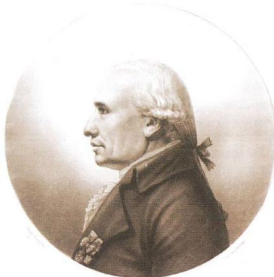
Fig. 2. Gaspard Monge (1746-1818).

"La Geometría Descriptiva tiene dos objetos: el primero, dar métodos para representar sobre una hoja de dibujo que no tiene más que dos dimensiones, a saber, longitud y anchura, todos los cuerpos de la naturaleza que tienen tres, longitud, anchura y profundidad, siempre que estos cuerpos puedan ser definidos rigurosamente.