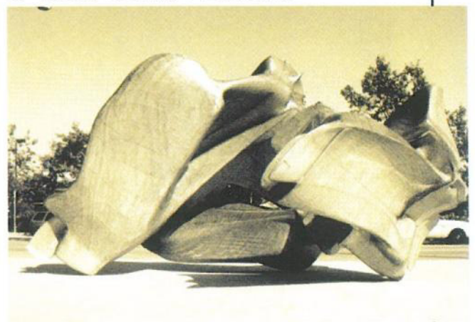
Fig. 4. Marcos Novak, 4Dwxy , Bienal de Venecia, 2000.