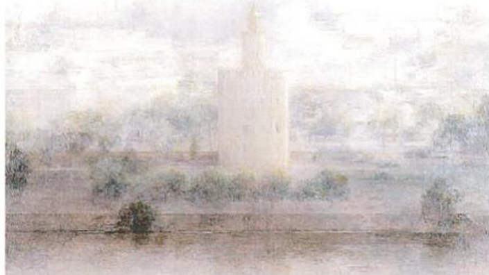
Fig. 9. Sevilla, por Carmen Laffón.

En el sur tan distante quiero estar confundido. La lluvia allí no es más que una rosa entreabierta; Su niebla misma ríe, risa blanca en el viento. Su oscuridad, su luz son bellezas iguales.