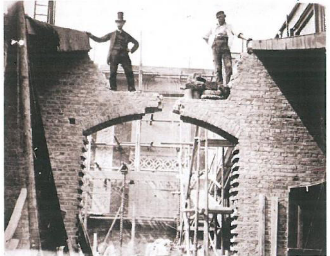
Fig. 5. Ensayo experimental de resistencia de un nuevo cemento por el capitán Henry Scott, 1861, Science Museum, Londres.

“Bajo este punto de vista es una lengua necesaria al hombre de genio que concibe un proyecto, a los que deben dirigir su ejecución y, en fin, a los artistas que por sí mismos, deben ejecutar sus partes diferentes.” 21