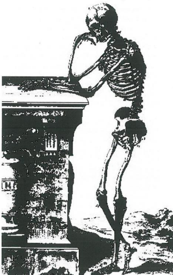
Fig. 7. "Esqueleto pensante", grabado de L'Encyclopédie .