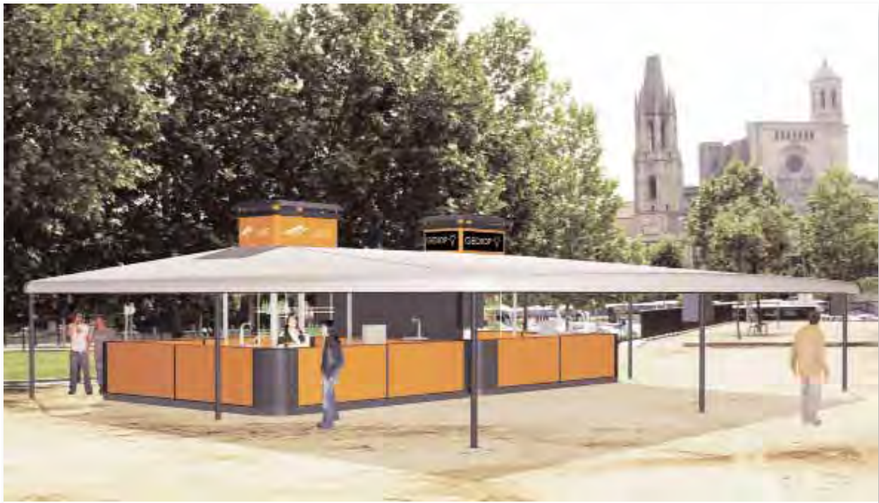
Proyectos realizados por los alumnos de tercer curso