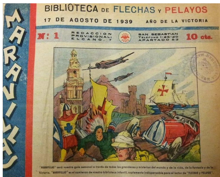
Figura 2. Portada inaugural de Maravillas , primera época, Biblioteca de Flechas y Pelayos , n° 1, 17 de agosto de 1939, p. 1.

En consonancia con el marco contextual trazado hasta el momento, cabe poner de manifiesto que, con la publicación de su primer número el 17 de agosto de 1939, Maravillas dio comienzo a una dilatada andadura que transcurrió de forma paralela a Flechas y Pelayos . Ambos cauces de difusión representaban, no obstante, como se ha indicado, dos de los mejores paradigmas del esquema propagandístico que impulsó el Estado franquista durante la posguerra (Ver Figura 2).