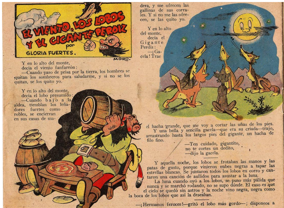
Figura 4. “El viento, los lobos y la gigante perdiz” de Gloria Fuertes con ilustraciones de Moro. Maravillas , nº 297, 17 mayo 1945, p. 1.

diversas producciones de los dos artífices confirieron un carácter innovador e interdisciplinar a los contenidos del suplemento. Para ello el empleo del humor sutil y la ironía de vuelo satírico tanto en el texto literario como en las imágenes, en una suerte de écfrasis , resultó crucial [27], puesto que suponían, en fin, un marcado distanciamiento estético con respecto al relato de corte moral imperante en Flechas y Pelayos . Además, desde este mismo prisma interdisciplinar, la escritora madrileña colaboró también con otros destacados artistas de la época, especialmente con Moro, quien ilustrase cuentos como “El viento, los lobos y el gigante perdiz” publicado en 1945 (Ver Figura 4).