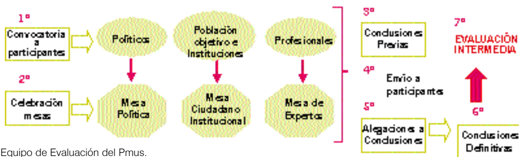
Gráfico 2. Enfoque participativo de las Mesas Técnicas II

Esta encuesta se ha aplicado a dos grupos de población o estratos: la población general y la población adjudicataria de vivienda protegida. Para cada uno de ellos se ha diseñado un cuestionario específico con el objeto de recabar de forma más precisa la información deseada en cada grupo poblacional, ya que se pretende, por un lado, conocer las características y necesidades de la población demandante de vivienda de la ciudad de Sevilla, y por otro, analizar el grado de satisfacción de la población que ha sido adjudicataria de vivienda protegida en la ciudad.