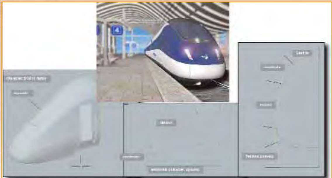
Figura 4: Carácter, líneas de carácter y propiedades estéticas asociadas

Cada una de ellas define propiedades de los lugares geométricos a los cuales se asocian y su relación con la geometría vecina.