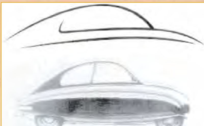
Figura 2: Líneas de carácter SAAB

El lenguaje de mercado es sensible al contexto (regional, cultural, temporal...), de forma que el diseñador es capaz de detectar las variantes o evoluciones debido a su experiencia y bagaje cultural, pero las aplicaciones informáticas deberán incorporar rutinas del tipo "Razonamiento Basado en Casos" (CBR)(CBR_WEB 2002; CBRring 2002) para tenerlo en cuenta.