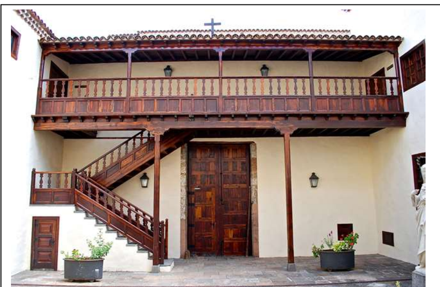
Fig. 1: Compás de entrada del Monasterio de Santa Catalina de Siena. San Cristóbal de La Laguna. Tenerife. Islas Canarias (2016).

Estos nuevos pobladores construyen sus viviendas siguiendo unos patrones que son importados