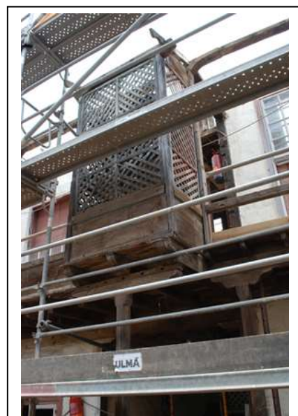
Fig. 3. Detalle de Destiladera o Pila. Obras de Rehabilitación del antiguo Noviciado del Monasterio de Santa Catalina de Siena durante las obras de rehabilitación en 2016. San Cristóbal de La Laguna. Islas Canarias.