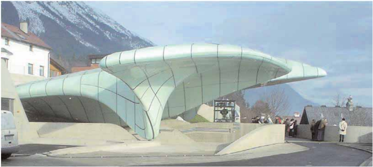
Fig. 4: Nordpark Cable Railway Station, Zaha Hadid Architects, Innsbruck, Austria, 2004-2007

espacios geométricos topológicos no euclídeos, a la aplicación de sistemas cinéticos y dinámicos y al empleo de criterios de diseño paramétrico y algorítmico, que están sustituyendo a los planteamientos tecnológicos de la arquitectura tradicional. (6)