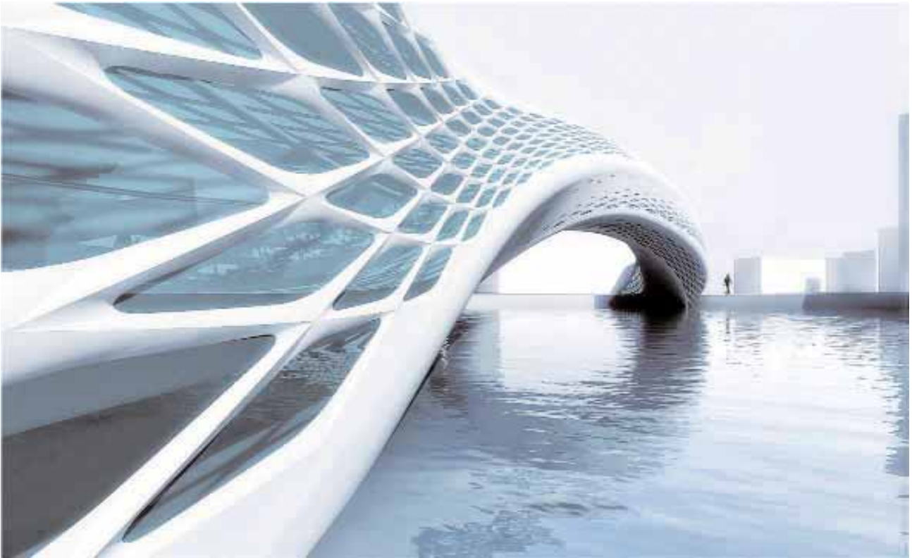
Fig. 5: Non-Linear Arch. Tutor Daniel Gillen, Parametric Design Workshop, THU, Beijing, 2010

generalmente en aspectos no estructurales (control ambiental, iluminación, elementos móviles de muros, etc...). Pero lo cierto es que el concepto de participación real en el diseño aún no ha sido asimilado de forma general y plantea grandes problemas.