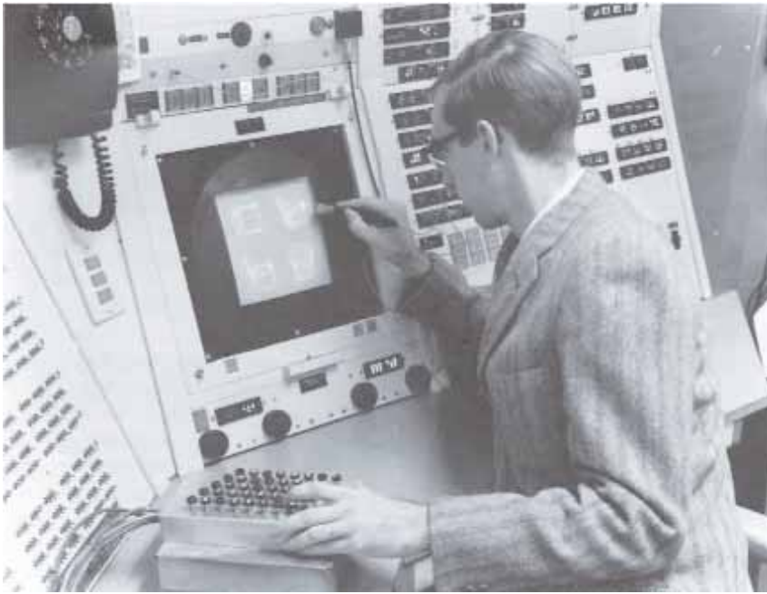
Fig. 7: Ivan Sutherland utilizando el programa Sketchpad en la consola TX-2 en el Lincoln Laboratory del MIT, 1963

subsistemas, la acentuación paramétrica, la figuración paramétrica, la sensibilidad paramétrica y, finalmente, el urbanismo paramétrico que integraría a todos los anteriores.