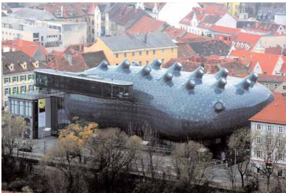
Fig. 3: Kunsthaus, Peter Cook & Colin Fournier, Graz, Austria, 2003

En consecuencia nos encontramos ante un nuevo cambio de tendencia, una arquitectura digital de segunda generación, que podría calificarse incluso como “post-digital”, en la que el arquitecto se convierte en diseñador de sistemas y procesos, en la línea ya marcada inicialmente por algunos pioneros como Gordon Pask al considerar que “el diseño es control del control”. (4)