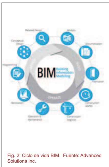
Fig. 2: Ciclo de vida BIM.

La amplia difusión y divulgación que está adquiriendo la metodología, involucrando a todos los sectores intervinientes en el ciclo de vida del edificio (Fig. 2) como benefactores del cambio, nos hace reflexionar sobre sus promesas y el reporte real/tangible de las mismas.