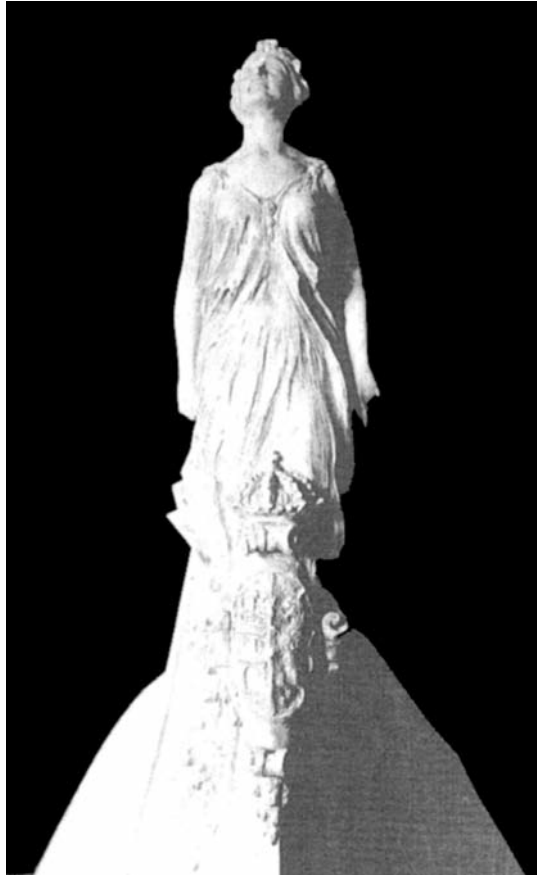
Frontal del modelo a escala del mascarón (1926). AMDAB.

Paralelamente a las maniobras del astillero, el Negociado de Campaña había recogido la propuesta de la Intendencia General (42) y pidió que la Comisión Inspectoras (43) desglosara los costes de la figura, diferenciados de los otros adornos pactados en la contrata con Echevarrieta. Era el momento para que el empresario moviera los