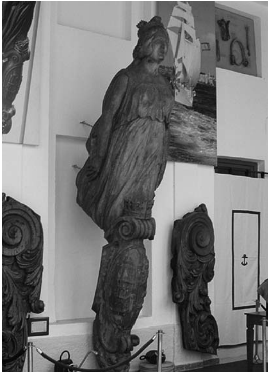
Original del mascarón de proa del Juan Sebastián de Elcano . (Museo Naval de San Fernando).