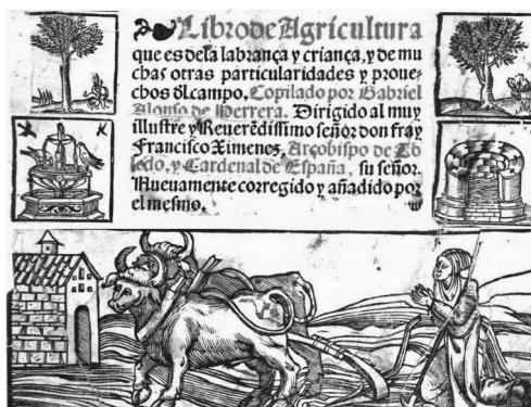
Fig. n.º 14.- Portada del Libro de agricultura . Compilación por Gabriel Alonso de Herrera. 1513.

El tratado de Alonso de Herrera al concluir el “Prólogo” presenta el texto dividido en seis libros. Los cuatro primeros dedicados a los cultivos del campo y su aprovechamiento consiguiendo por el hombre. Viene tras ellos el quinto dedicado a mostrar cómo se deben tratar las crías de ciertos animales útiles para la vida de los humanos; así se encuentran tratados las abejas (y