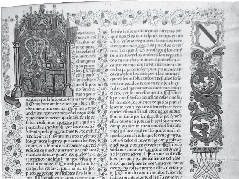
Figura 6.- Siete Partidas de Alvaro de Estúñiga, Madrid, Biblioteca Nacional, ms. Vit.24-6, f.6.