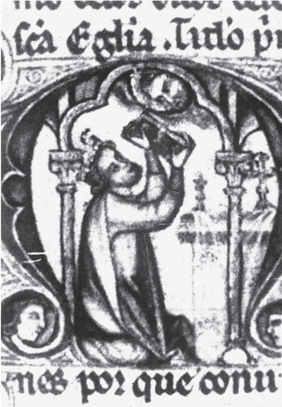
Figura 4.-Alfonso X vicario de Dios, British Library, Add.ms.20787, f.1v.