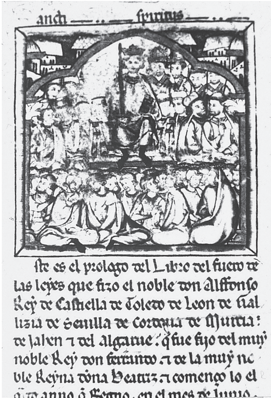
Figura 1.- Alfonso X como legislador, British Library, Add. ms. 20787, f.1