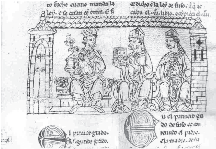
Figura 5.- Rey obispos, Fuero Juzgo del Ayuntamiento de Murcia.