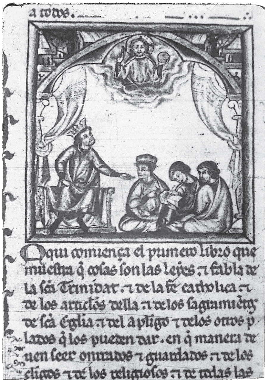
Figura 3.-Retrato de autor de Alfonso X el Sabio, British Library, Add.ms.20787, fl.v.