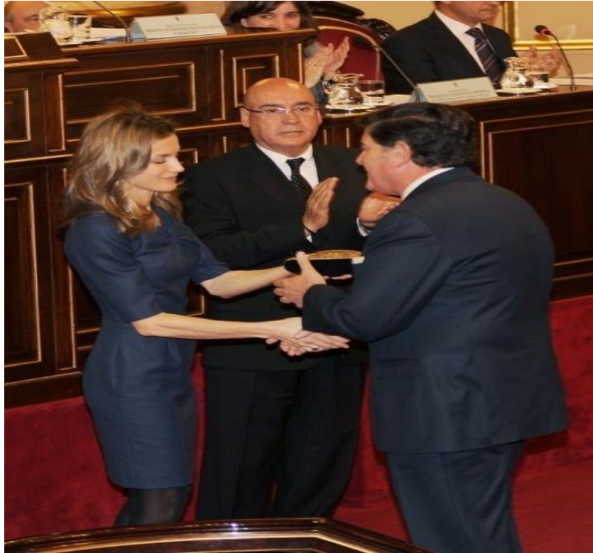
Figura 15. Reina Letizia entregando en el Senado los Premios FEDER

Destaca que a lo largo del ejercicio de la profesión, tanto comunitaria como colegial, lo más reseñable es el contacto humano con los pacientes, y con los compañeros de profesión. Su objetivo a lo largo de la vida ha sido ser y sentirse útil, crear una profesión mejor que la que conoció cuando terminó la carrera, ajustándose a los numerosos cambios que se han producido en este período de tiempo de más de treinta años. Y para terminar, cito literalmente: