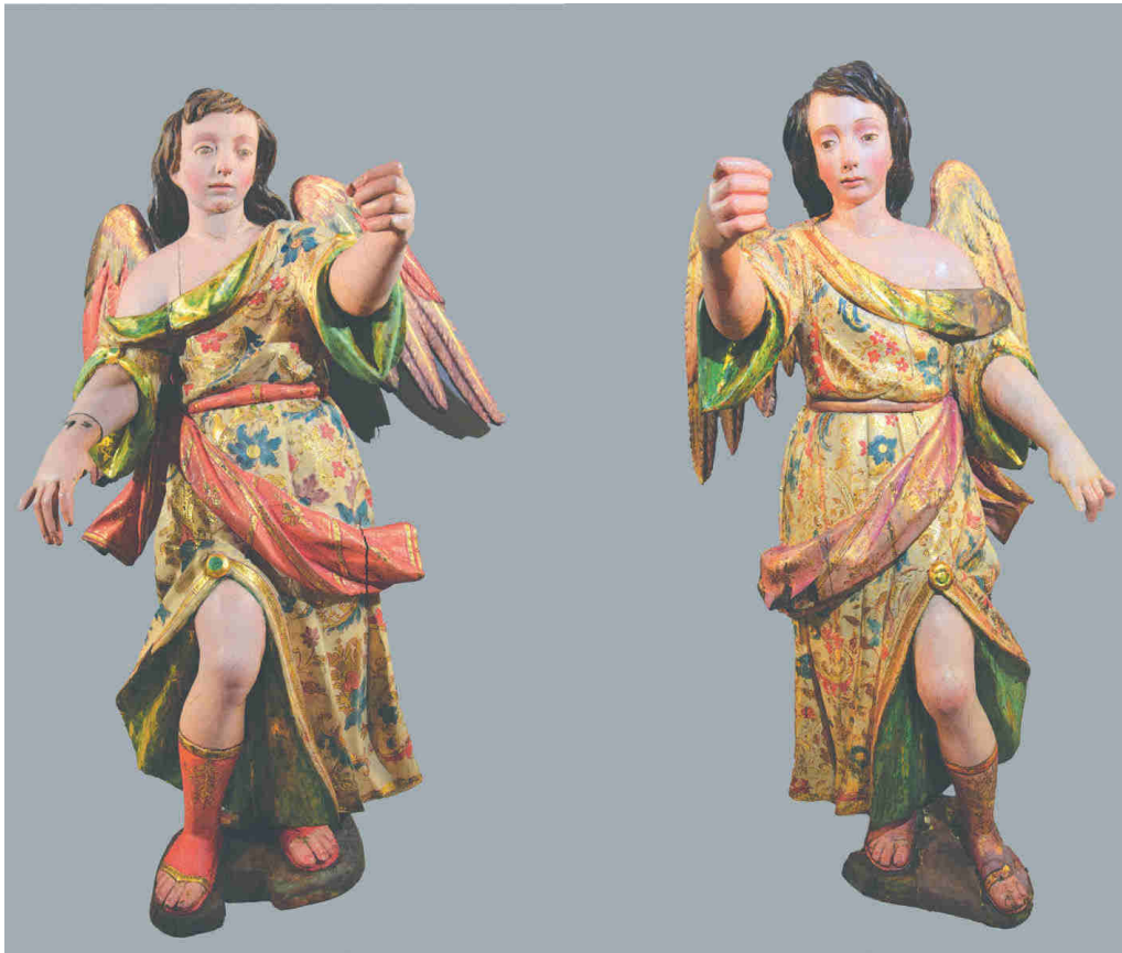
Figura 10. Ángeles mancebos del retablo de la VOT de Santo Domingo de Guzmán.