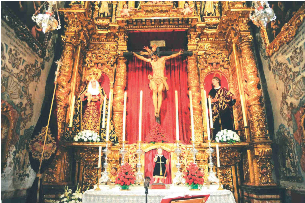
Figura 4. Cuerpo principal del retablo de la VOT de Santo Domingo de Guzmán, que acoge desde 1927 las imágenes titulares de la Hermandad del Calvario.