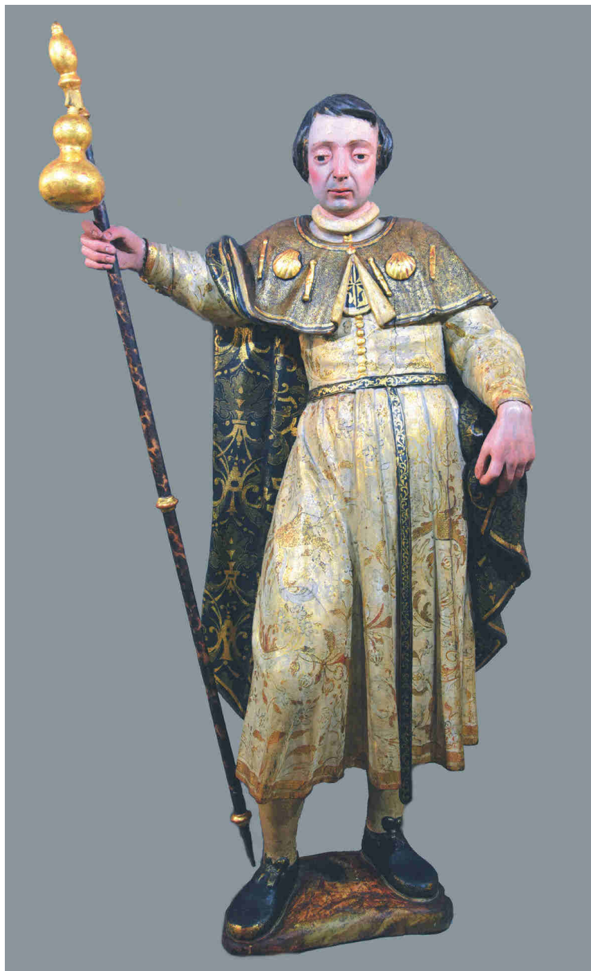
Figura 9. Una posible representación del beato Alberto de Bérghamo, con la esclavina y el bordón de peregrino.