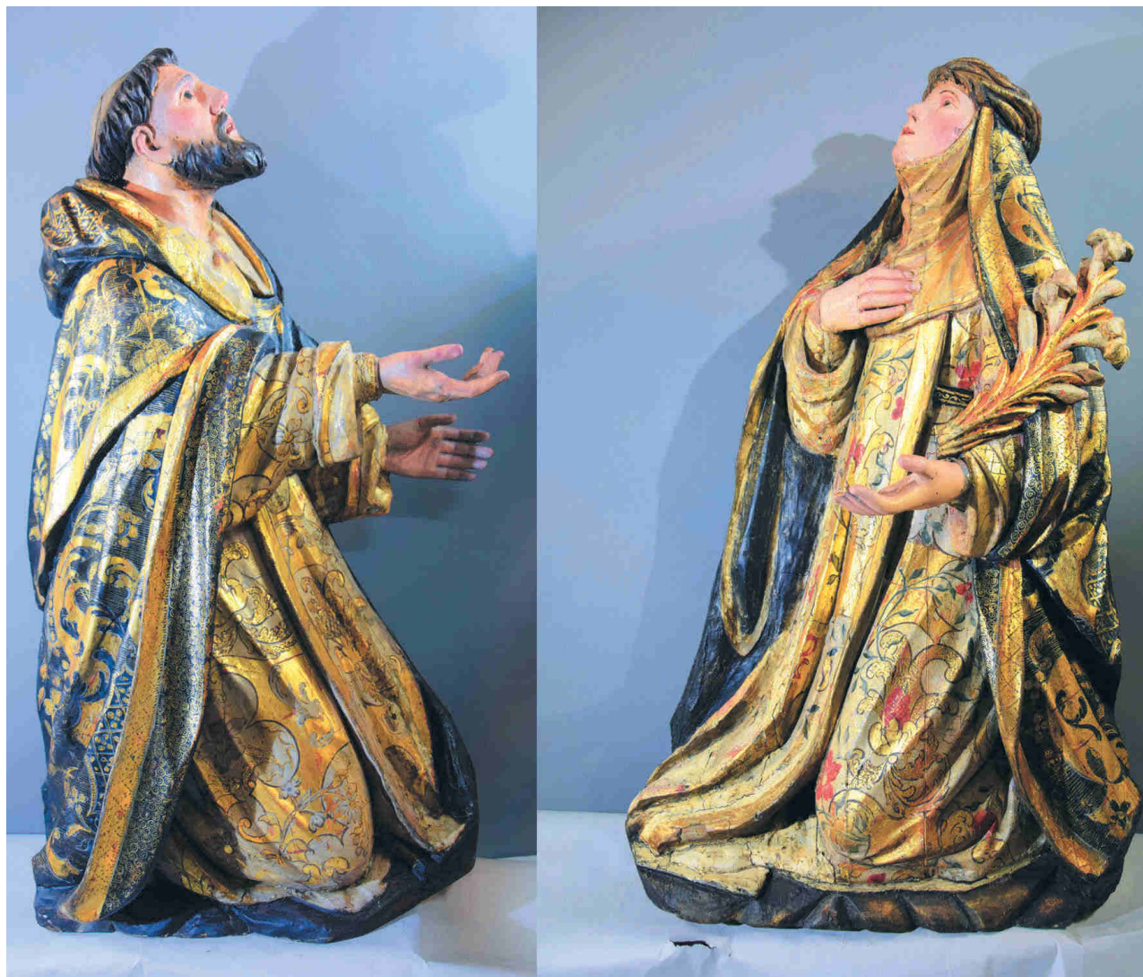
Figura 7. Esculturas de Santo Domingo de Guzmán y Santa Catalina de Siena que se postran arrodilladas ante la Virgen del Rosario.