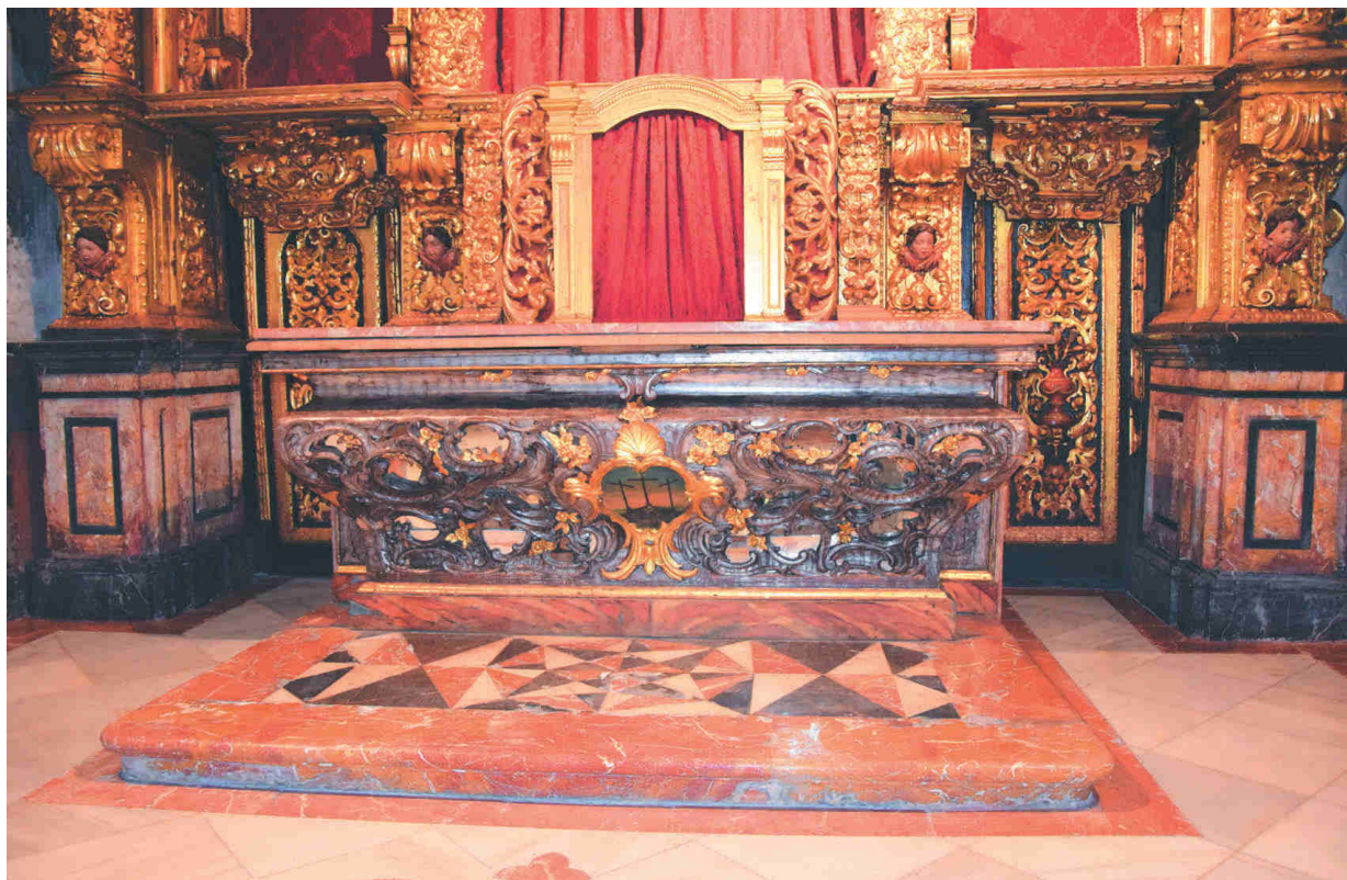
Figura 3. Mesa de altar y banco del retablo de la VOT de Santo Domingo de Guzmán.