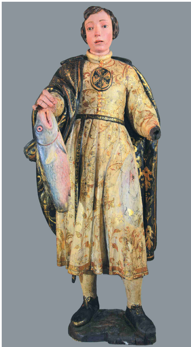
Figura 8. Escultura de un terciario dominico que pudiera identificarse con el beato Nicolás de Holanda.