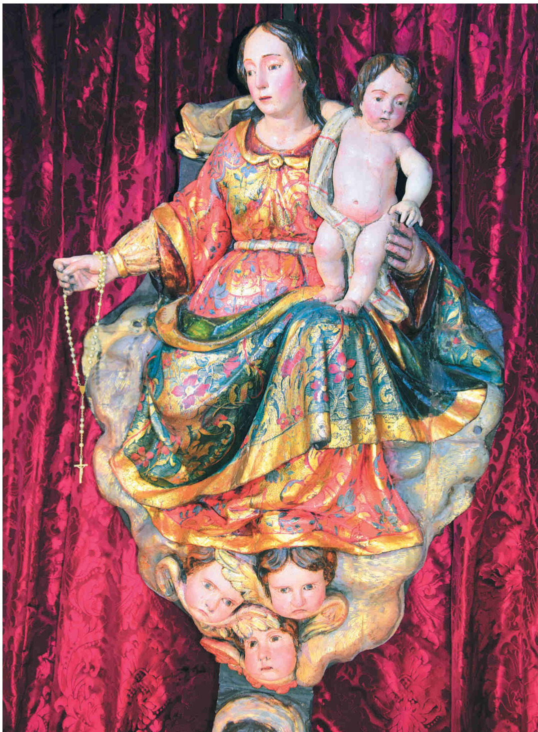
Figura 6. Virgen del Rosario entronizada en el camarín del segundo cuerpo del retablo de la VOT de Santo Domingo de Guzmán.

Archivo Dominicano XXXIX (2018) 237-263 [27]