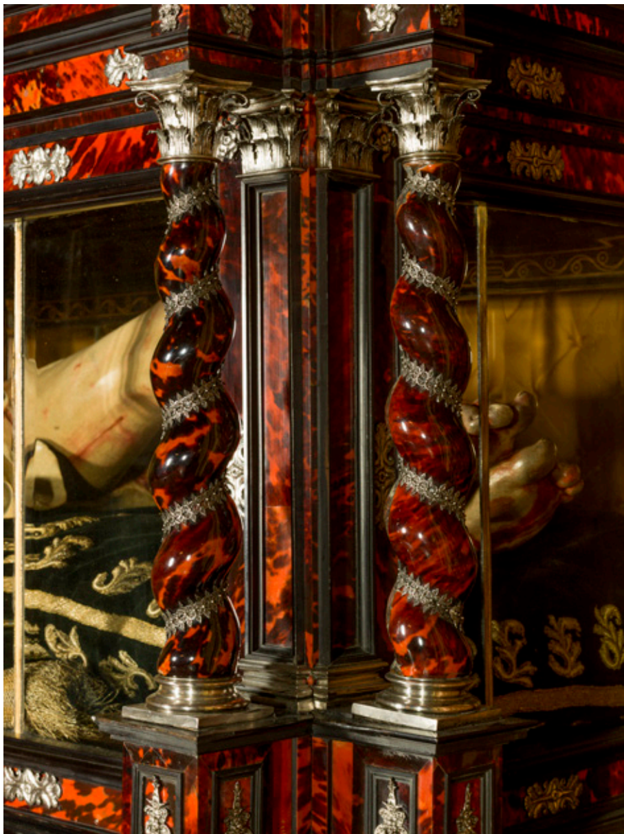
Figura 4. Detalle de las columnas salomónicas de la urna del Santo Sepulcro, Concatedral de Santa María de la Redonda, Logroño.