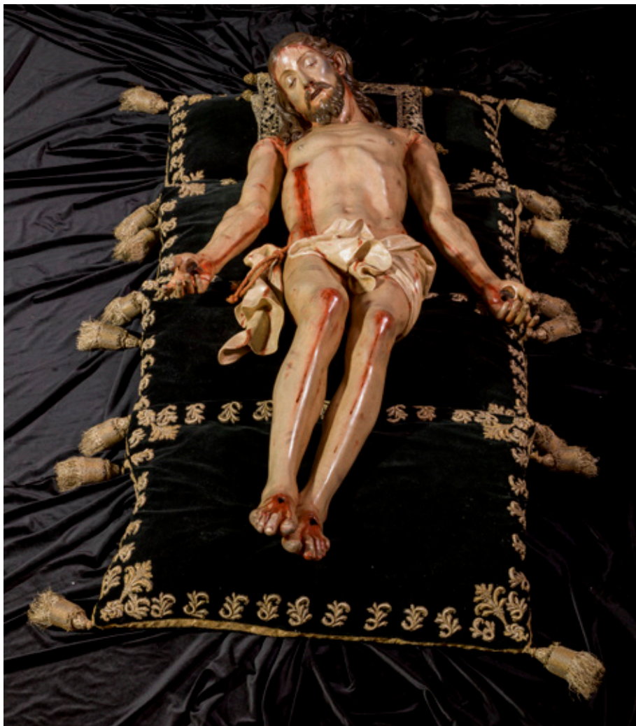
Figura 5. Cristo yacente , Concatedral de Santa María de la Redonda, Logroño.