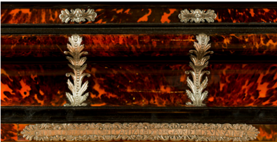
Figura 3. Detalle de una de las cartelas de la base de la urna del Santo Sepulcro , Concatedral de Santa María de la Redonda, Logroño.