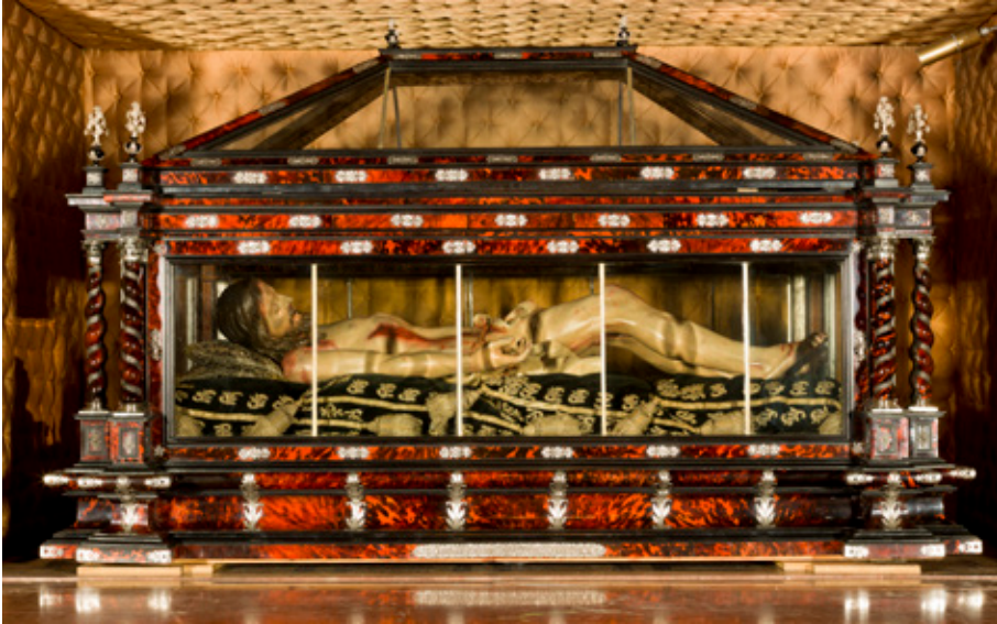
Figura 2. Santo Sepulcro , Concatedral de Santa María de la Redonda, Logroño.