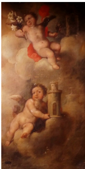
Figura 4. Ignacio de Ríos, Inmaculada Concepción (detalle lateral izquierdo de ángeles y símbolos marianos), Hermandad del Santísimo Cristo de la Expiración, Morón de la Frontera.