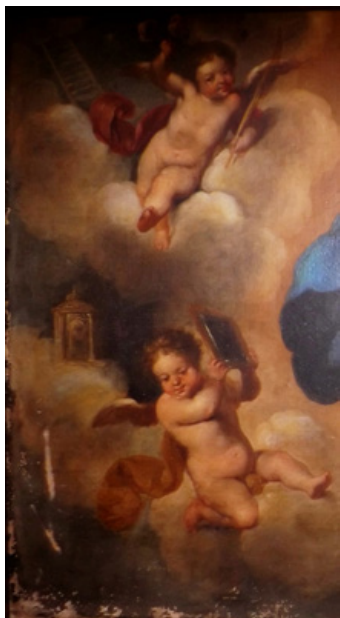
Figura 3. Ignacio de Ríos, Inmaculada Concepción (detalle lateral derecho de ángeles y símbolos marianos), Hermandad del Santísimo Cristo de la Expiración, Morón de la Frontera.