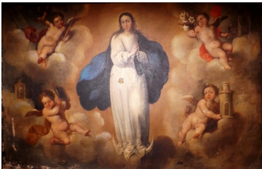
Figura 1. Ignacio de Ries, Inmaculada Concepción , Hermandad del Santísimo Cristo de la Expiración, Morón de la Frontera.