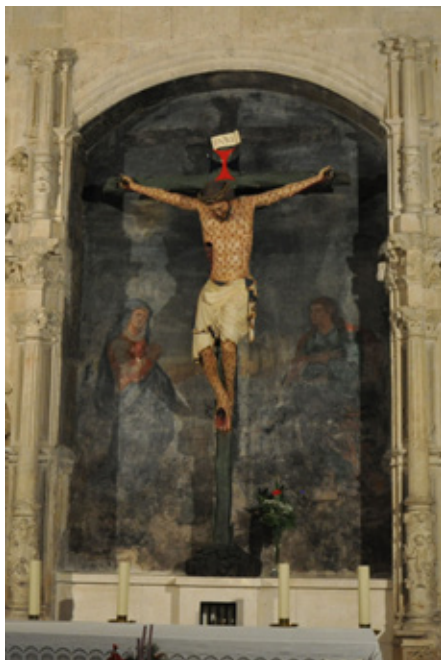
Figura 3. Cristo de Burgos o de la Trinidad , parroquia de San Gil, Burgos.