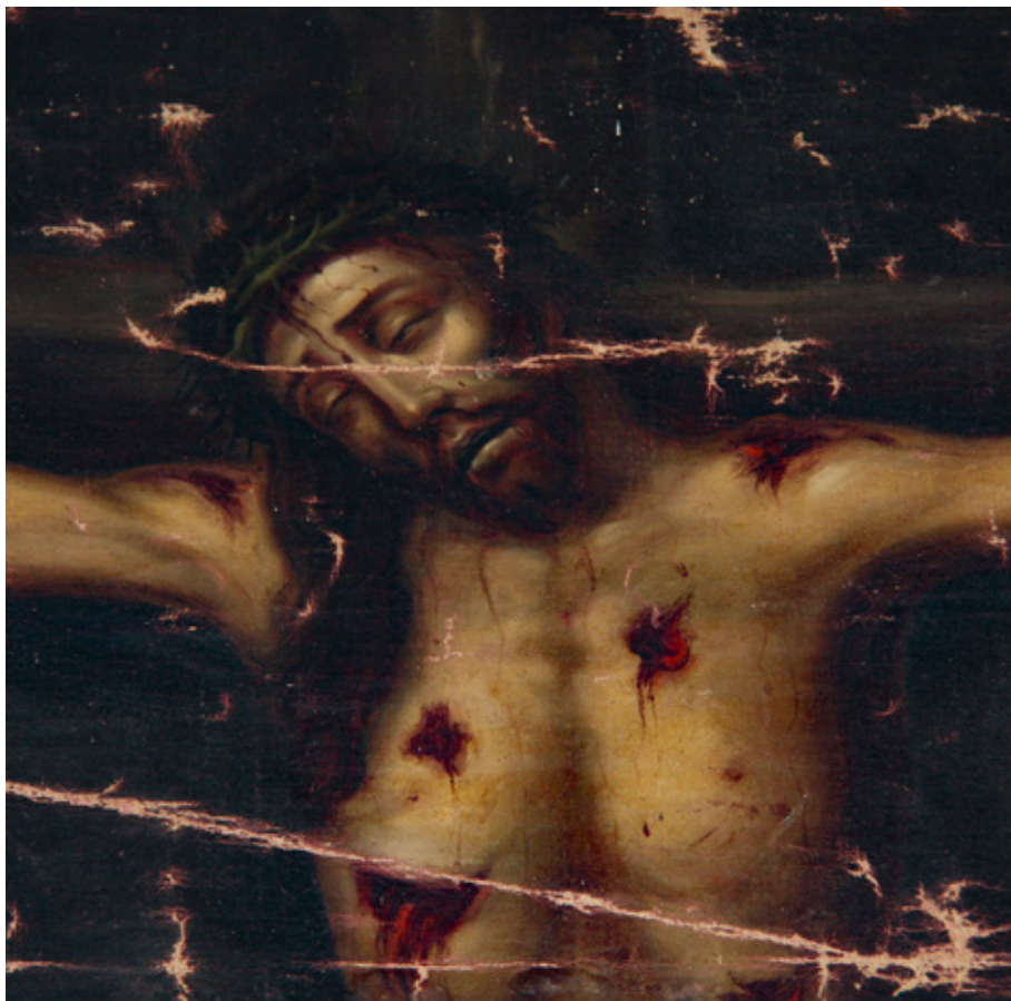
Figura 8. Juan de Villalobos, Cristo de Burgos (detalle), San Pablo de Apetatitlán (Tlaxcala).