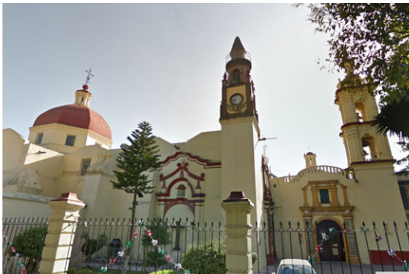
Figura 5. Conjunto parroquial de San Pablo de Apetatitlán (Tlaxcala).