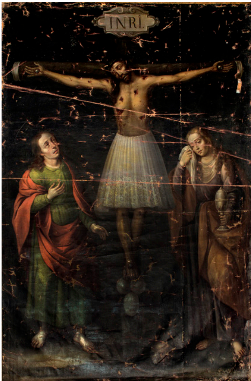
Figura 7. Juan de Villalobos, Cristo de Burgos , San Pablo de Apetatitlán (Tlaxcala).