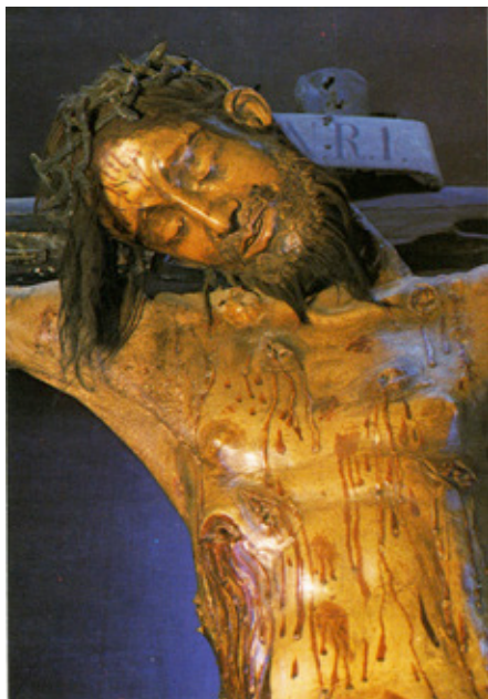
Figura 2. Cristo de Burgos o de San Agustín (detalle), catedral de Burgos.