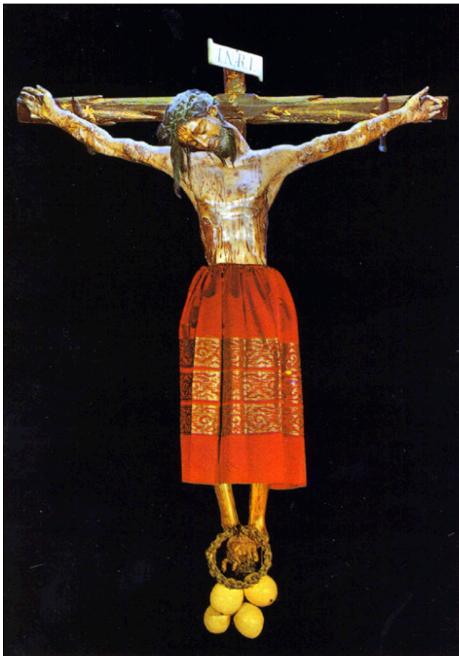
Figura 1. Cristo de Burgos o de San Agustín , catedral de Burgos.