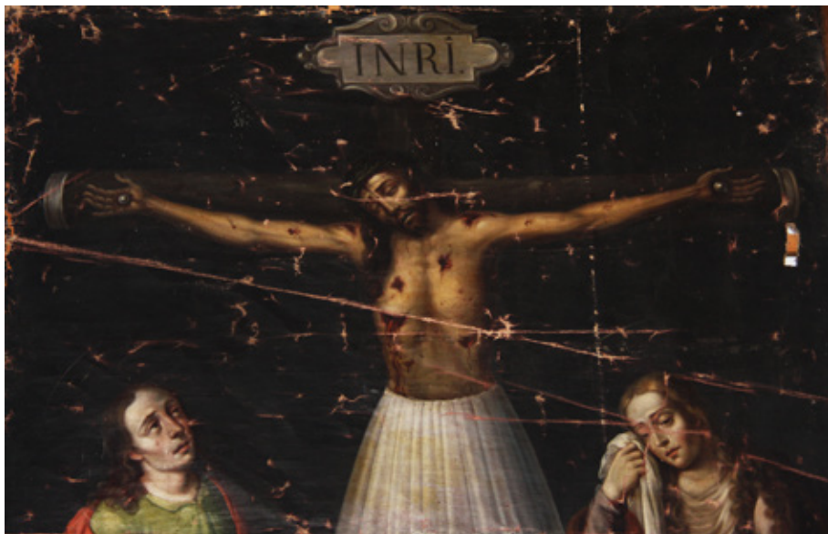
Figura 9. Juan de Villalobos, Cristo de Burgos (detalle), San Pablo de Apetatitlán (Tlaxcala).