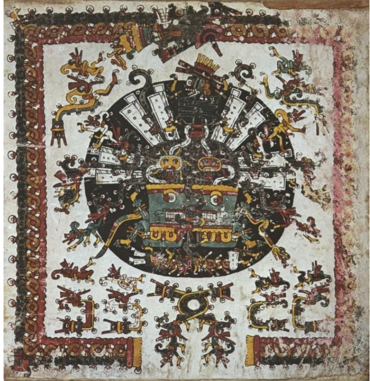
Fig 7. Una impresionante escena del inframundo. Anders, Jansen y Reyes (eds.), Códice Borgia , fol. 29