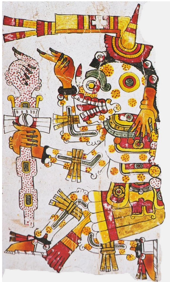
Fig. 2 El dios Miclatecuhtli . (detalle) Ferdinand Anders, Martin Jansen y Luis Reyes (eds.), Códice Borgia . México: Akademische Druck- und Verlagsanstalt, Fondo de Cultura Económica, 1998, fol 56.

Es decir, este dios fue un guerrero. Ostenta una larga lengua, fuera de la boca, a veces sustituible por un cuchillo; en diversas pinturas parece claro que se trata de imitar la lengua de fuera de un mamífero muerto. Hay otro cuchillo que suele ubicarse cerca de la nariz (o la cavidad nasal); a veces se le ha identificado