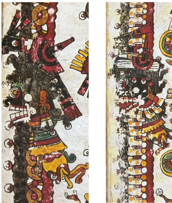
Fig. 8. A la izquierda, la entidad que forma con su cuerpo el espacio nframundano en la fig. 7. Ibíd. , fols. 29 y 30 (detalle)

En tanto nivel cósmico, más allá de si éste se encuentra perfectamente localizado y determinado hasta el fondo de los inframundos, o si su naturaleza es más difusa y penetra o no en otros estratos, debe tener entradas y salidas, como las tienen otros dioses. La tierra en general, por ejemplo, tiene umbrales que penetran hacia su interior.