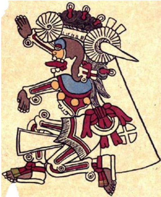
Fig. 1 El dios Mictlantecuhli . Códice Borbónico [en línea] lám. 10 (detalle). Fundación para el Avance de los Estudios Mesoamericanos Inc. http://www.famsi.org/spanish/research/loubat/Borbonicus/thumbs0.html [Consulta 10 mayo 2018]