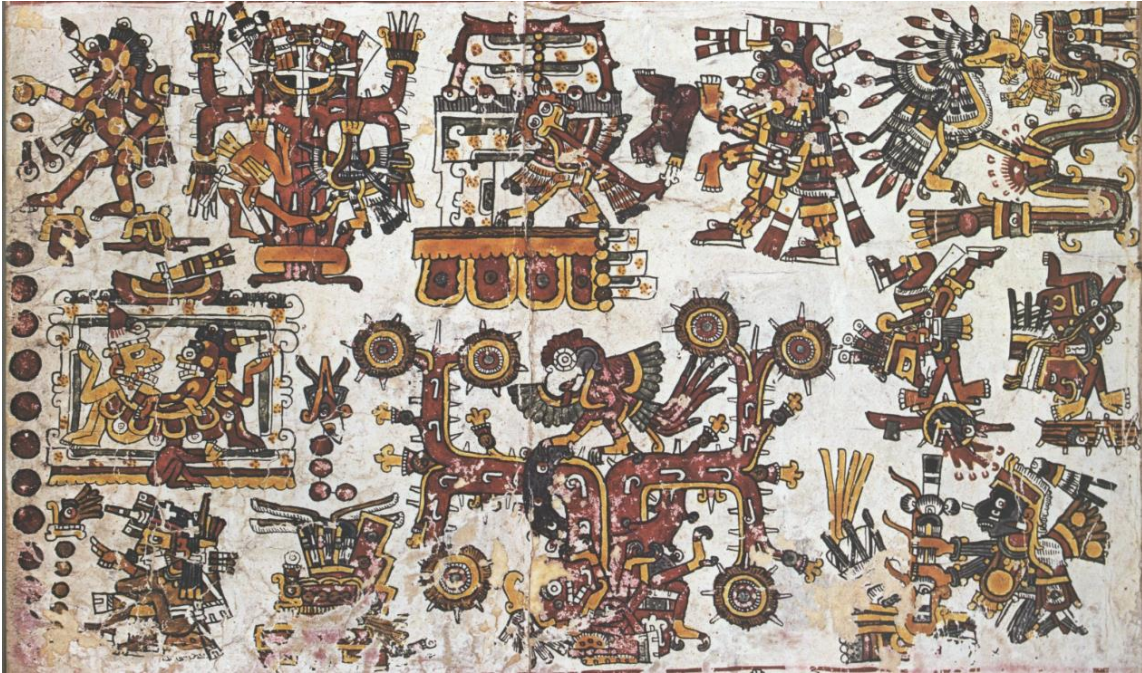
Fig. 10. El rumbo cósmico del sur en el Códice Borgia (Ibídem: fol. 52)

contienen la personalidad y la animación, la materia ligera, de las deidades de la muerte, incluso portan sus atavíos (fig. 10).