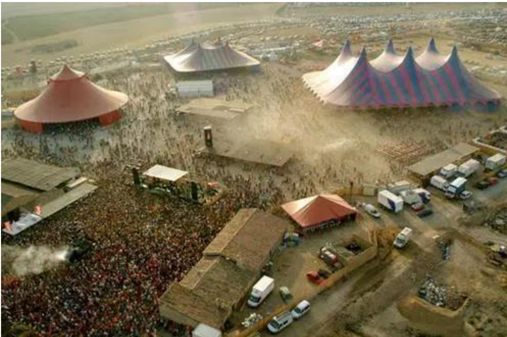
Vista aérea Monegros Festival

Este festival tenía como objetivo ofrecer música electrónica durante tres días seguidos, de esta forma se mantenía vivo el ideario “raver” pero con los años fue regularizándose y perdiendo esencia, hasta ser cancelado en 2014.