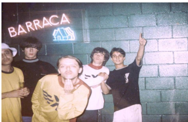
Jóvenes de fiesta en la sala Barraca

Con el paso de los años aparecieron más salas dedicadas a este tipo de eventos diurnos, entre ellas destacan NOD, Puzzle y ACTV, de esta forma se creó en la Comunidad Valenciana el mayor movimiento clubbing que España haya visto en su historia. La “movida” valenciana agrupaba a finales de 1980 alrededor de 10 salas dedicadas a la celebración de fiestas diurnas a nivel profesional, mientras que por aquel entonces en Londres y Berlín estos eventos, comenzaban a emerger pero con carácter tímido y no oficial. ( https://www.vice.com/es/article/53g88x/ruta-bakalao-movida-valenciana-cultura-club )