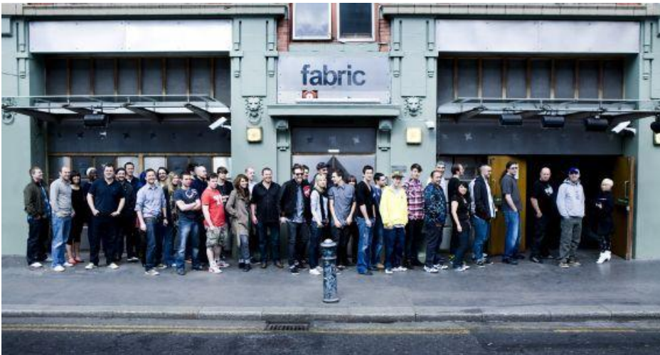
"Ravers" esperan para entrar en Fabric London