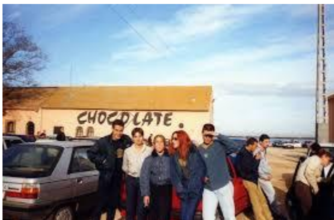
Jóvenes en el aparcamiento de la sala Chocolate

Por otra parte existía y existe Ibiza, una de las ciudades protagonistas del movimiento clubbing ,en una primera instancia puede sorprender , ya que cuando comenzaron a emerger los eventos festivos de esta isla , España estaba en una dictadura o bien en un proceso posdictatorial . Primeras discotecas: