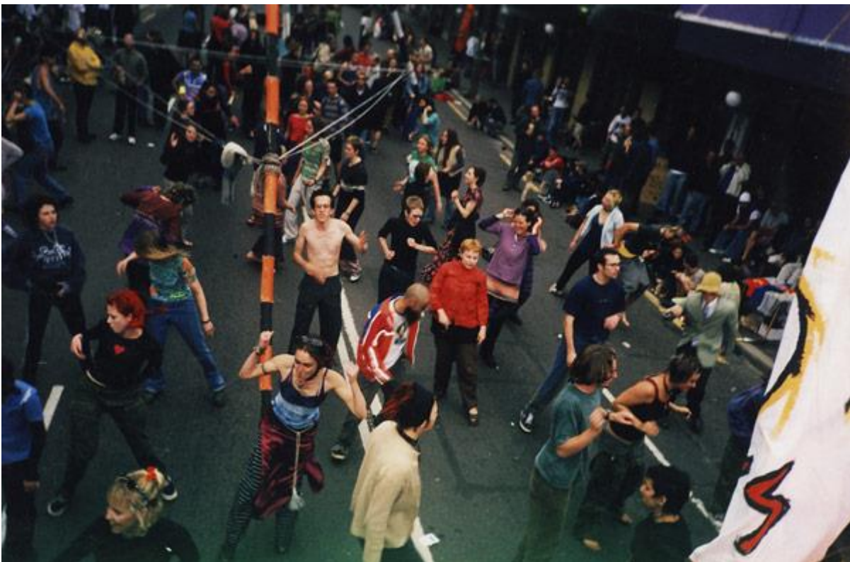
Jóvenes en una fiesta "rave"

Greg Harrison, G. H. (2000). Con la música a tope [Archivo de vídeo ]. Recuperado de http://hdfull.tv/Conlamusicaatope.com