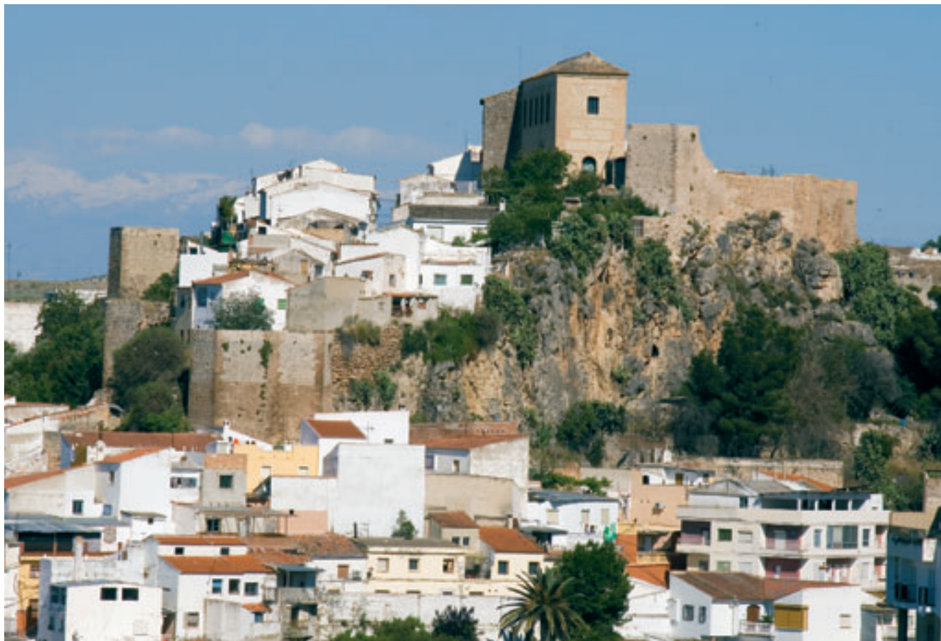
Vista general y entorno de Loja.

En los casos de procesos para la formación de un distrito cultural , un programa o un proyecto complejo de desarrollo integrado, donde el control no puede limitarse a un simple examen de los gastos, debe estar previsto proporcionar a los actores de las intervenciones un instrumento eficaz para la gestión conjunta del programa. Las metodologías y procedimientos de control y de evaluación comunmente admitidos no logran siempre identificar las urgencias y los efectos inesperados. Tampoco logran medir en muchos casos el nivel de satisfacción de ciertas condiciones requeridas, como la integración a diferentes niveles: entre sujetos, políticas, sectores administrativos, etc.; la territorialidad de los proyectos o la colaboración entre los actores. En esta perspectiva, el proceso de evaluación in itinere -evaluación efectuada en cualquier momento de la intervención/proceso- está considerado como un instrumento útil para corregir los proyectos en ejecución y obtener enseñanzas para la formulación de nuevas políticas locales. La utilidad del control/evaluación in itinere se pone de manifiesto en los siguientes aspectos: