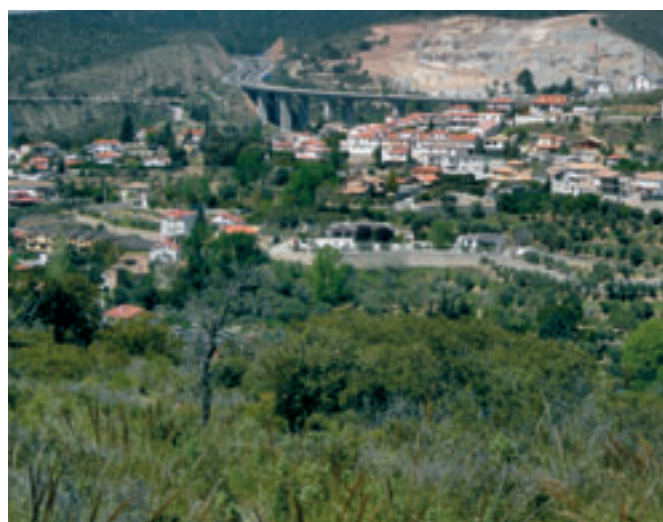
Huétor desde el Colmenar.