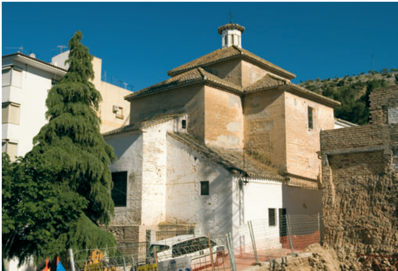
Vista exterior de la Ermita Nuestro Padre Jesús Nazareno (Loja).