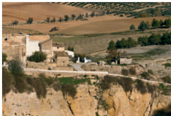
Casas sobre los tajos (Alhama).

Se ha tomado el referente histórico de la frontera entre los antiguos reinos de Castilla y Granada para reforzar la identidad cultural