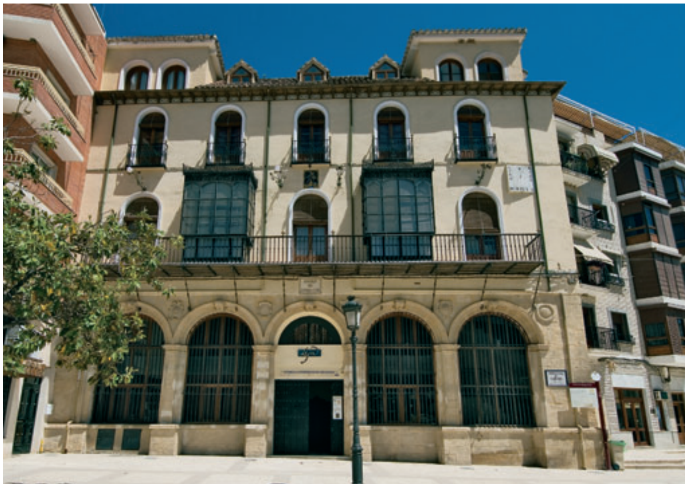
Vista de la fachada de la antigua Casa Cabildo en Loja, actual Centro de Interpretación Histórica.

hemos recurrido a medir los efectos directos e inmediatos conseguidos por la realización de las actuaciones. Por tanto, se analiza el grado en que ha mejorado la dotación de recursos en el territorio al poner en valor ese patrimonio, así como los empleos generados.