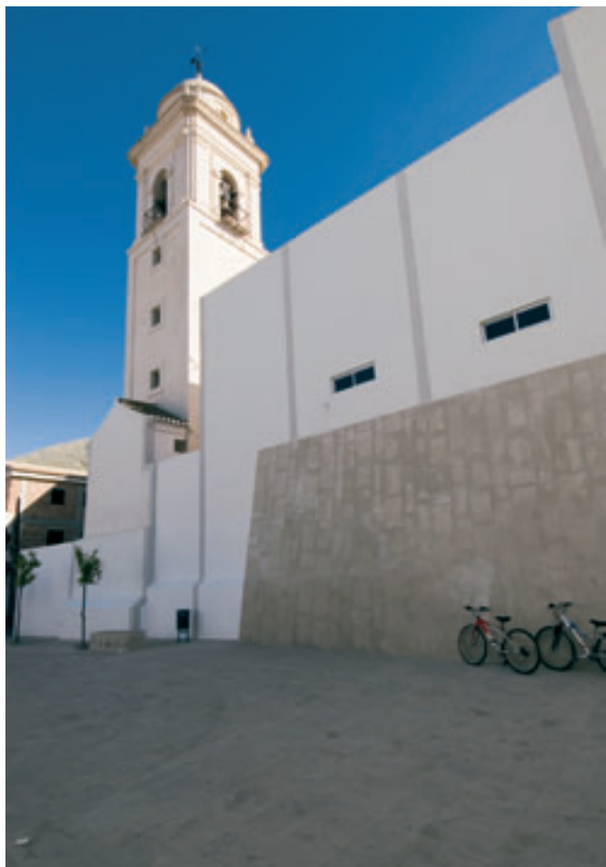
Vista de la torre de la Iglesia parroquial de Santa Catalina (Loja).

vos estuviesen más detallados, vinculando cada objetivo a una única acción.