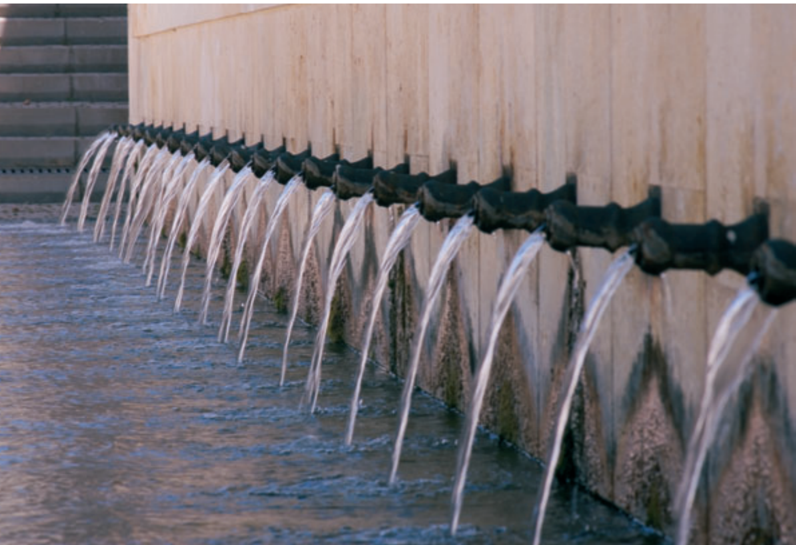
Perspectiva de la Fuente de los veinticinco caños (Loja).