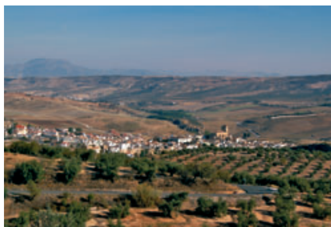
Alhama.