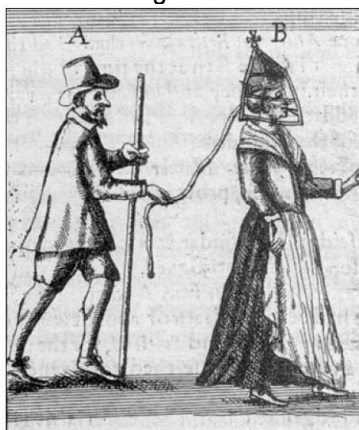
Ilustración 1: Una “regañona” es hecha desfilar.

estatal contra el cuerpo proletario, y es uno de los acontecimientos más importantes del desarrollo del proletariado moderno y de la sociedad capitalista. Una campaña de persecución contra las mujeres que debilitó la capacidad de resistencia del campesinado europeo y profundizó las divisiones entre mujeres y hombres. La caza de brujas fue “un elemento esencial de la acumulación originaria y de la “transición” al capitalismo” (2010, pp.223-224). Esta campaña de terror –que alcanzó su punto máximo entre 1580 y 1630– enseñó a los hombres a ver a las mujeres como destructoras del sexo masculino y a temer su poder, un poder obtenido “en virtud de su sexualidad, su control sobre la reproducción y su capacidad de curar” (2010, p.233). Asimismo, se atacó la resistencia de mujeres cuyas prácticas y creencias desafiaban y eran incompatibles con la disciplina del trabajo capitalista.