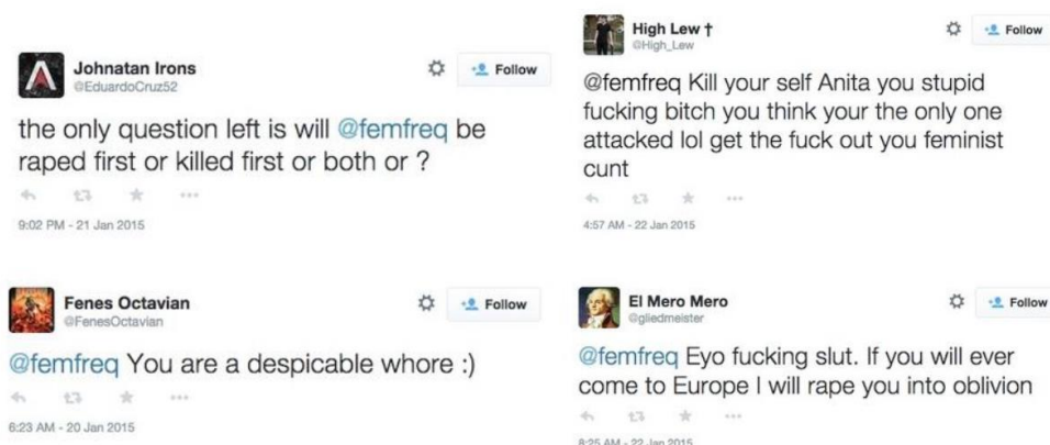
Ilustración 3: Ejemplos de los tuits recibidos por Sarkeesian.

amenazas de bombas en sus eventos públicos y, a día de hoy, tiene un expediente abierto con el FBI, al que sigue mandando los mensajes amenazantes que sigue recibiendo.