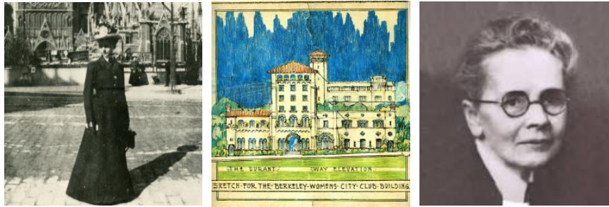
Figura 3. Julia Morgan y un boceto de una de sus obras