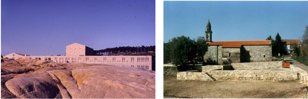
Figura 17. Escuela de formación pesquera, Isla de Arousa, 1990-1992 (izq.) y restauración de la iglesia de Sabucedo y su entorno, 1998 (dcha.)