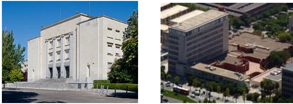
Figura 1. ETSAM (izada) y ETSAB (dcha.)