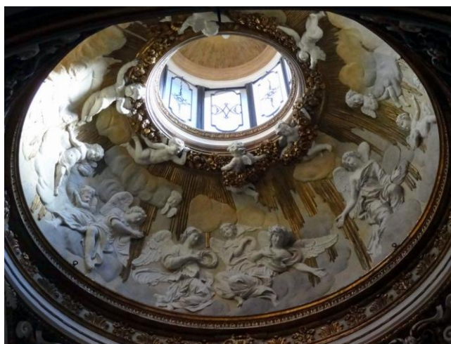
Figura 2. Cúpula de la capilla de San Luis rey de Francia (Roma)