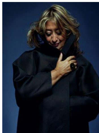
Figura 5. Zaha Hadid

Zaha Hadid (Bagdad, Irak, 1950 - Miami, Florida, Estados Unidos, 2016) se licenció en Matemáticas en la Universidad Americana de Beirut, antes de estudiar Arquitectura en la Architectural Association of London. Una vez graduada se hizo socia y trabajadora del despacho de Remo Koolhaas, que había sido profesor suyo.