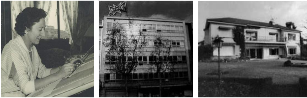
Figura 7. Matilde Ucelay trabajando en su casa y distintos proyectos suyos construidos.