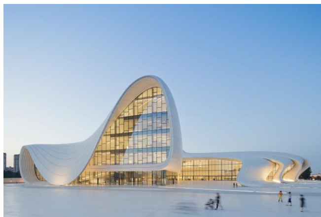
Figura 6. Centro Cultural Heydar Aliyev, en Bakú (Azerbaiyán)

Con el cambio de milenio comenzó el período más prolífico de Zaha, quien ya había alcanzado un gran renombre internacional, como ponían de manifiesto los numerosos premios y reconocimientos: miembro honorario de la Academia de las Artes y las Letras de Estados Unidos e integrante del Instituto Americano de Arquitectura (2000), entre otros.