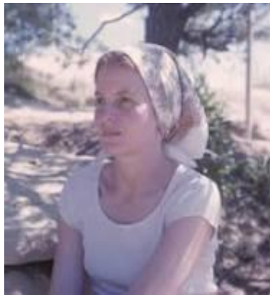
Figura 4. Denise Scott, en su juventud y en su madurez

Denise está considerada como la arquitecta más famosa de la segunda mitad del siglo XX. Se casó con Robert Venturi en 1967 y trabajaron juntos desde 1969. Sin embargo, en 1991 fue excluida del premio Pritzker concedido a su marido, lo que provocó su protesta y el debate sobre las dificultades de las mujeres arquitectas para ser reconocidas en su profesión. Pese a que su marido reconoció que sus trabajos estaban realizados por ambos al cincuenta por ciento, ella no obtuvo ningún tipo de reconocimiento por el jurado del premio. Finalmente, se les otorgó de manera conjunta la Medalla de Oro del AIA 2016, convirtiéndose ella así en la segunda mujer de la Historia que gana el galardón más prestigioso del mundo de la Arquitectura y en la primera mujer viva que lo recibe.