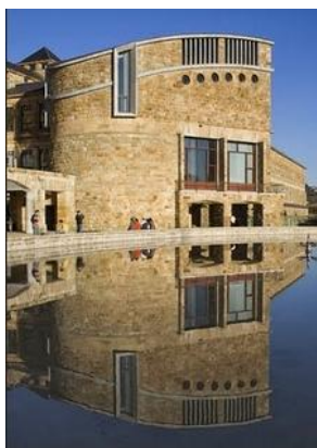
Figura 13. Paraninfo de la Universidad Laboral de Gijón.