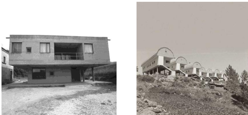
Figura 16. Vivienda rectoral en Marín 1968-1969 (izq.) y viviendas para gitanos en Campañó, 1970-1972 (dcha.)