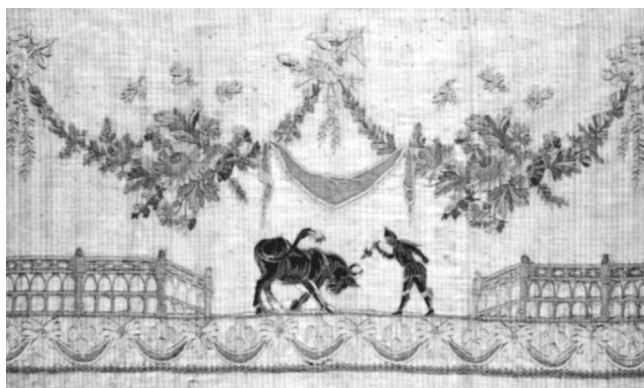
Fig. n.º 24.- Toro y espada en la plaza , fragmento de seda bordada, 1800.

Bellas Artes y en la que destacaban algunos cuadros taurinos como Sevilla. Los toreros y El Encierro . El primero es uno de los lienzos con más color y luz que nunca hayamos visto de un paseíllo en la plaza de la Real Maestranza de Sevilla y el segundo expresa un traslado de toros a la vieja usanza, es decir, con bueyes y vaqueros a caballo, representado en el momento en que atraviesa unas vías de ferrocarril, un símbolo de intersección del pasado y la modernidad que pronto asumirán los ganaderos, que