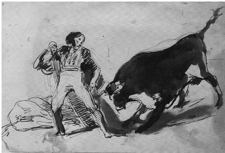
Fig. n.º 23.- Leonardo Alenza: Capeo a la Navarra , aguada de sepia.

El núcleo de esta espléndida colección taurina está formada por el Archivo y la Biblioteca de Luis Carmena y Millán, que adquirió el hispanista norteamericano Archer Milton Huntington por la cantidad de 30,000 reales en 1903. Al año siguiente, el mecenas creó The Hispanic Society . Sin embargo, la excelente colección de Carmena permaneció en sus manos y sólo pasó a la Fundación después de su muerte, con lo que estimo que así