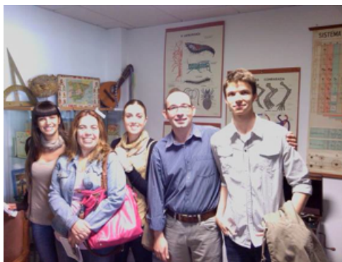
Alumnado de la asignatura Historia de la Educación Contemporánea.