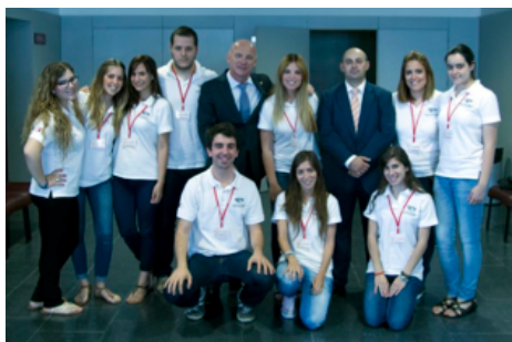
Equipo Organizador del Congreso