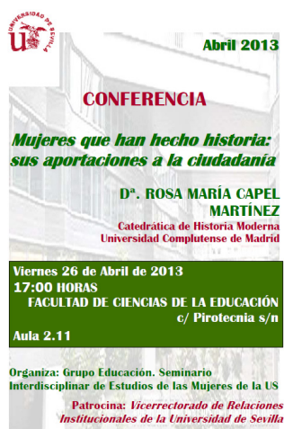
Carteles informativos de la actividad