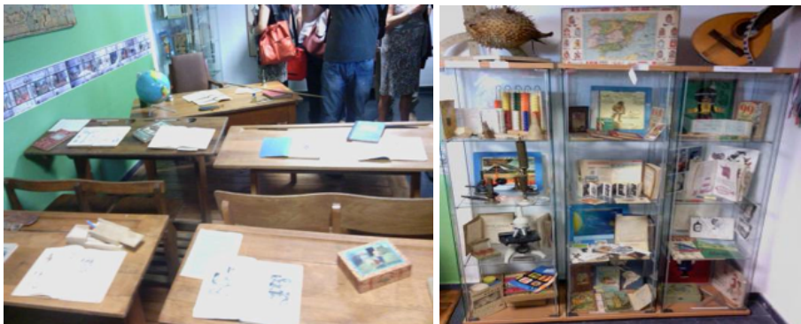
Recreación de aula del Museo Pedagógico y Vitrinas expositoras del Museo Pedagógico de la Facultad de CCEE de la Universidad de Sevilla.